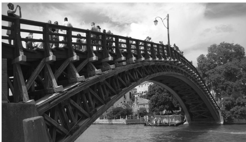
ПАНІ ІСТОРІЯ ЗУПИНЯЄ МИТЬ

Наступний кадр показує образ мандрівної філософині, яка фіксує те, що предстает перед її поглядом як важливий сенсовміщуючий кластер. Фотографія відображує одну з складових частин філософської мандрівки як інтелігібельного феномену. Жіноча фігура у контексті візуальної філософії цього кадру репрезентує Враження.