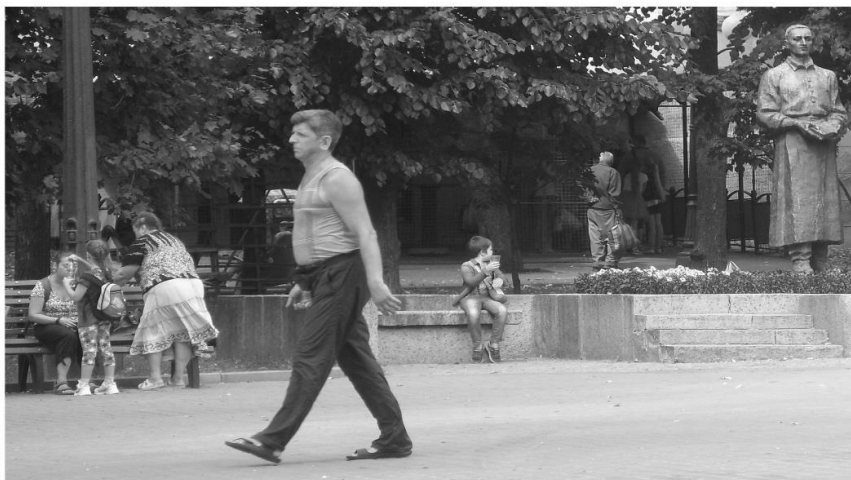
ЗАЦІКАВЛЕНІСТЬ, РУХ ТА ОСМИСЛЕННЯ

Немов би разом зі Сковородою повертаючись з Венеції до Харкова, на наступному фото споглядаємо групу людей, які відпочивають або проходять біля пам'ятника Григорію Сковороді у Соборному сквері на вулиці Університетській. Фотографія репрезентує основні складові філософської мандрівки як інтелігібельного феномену. Фігура чоловіка, що йде, відображує Рух. Фігури жінок біля лави репрезентують Відпочинок. Фігура юнака, який дивиться углиб кадра відображує Зацікавленість. Фігура літньої людини репрезентує Досвід. Скульптурна фігура Сковороди у контексті візуальної філософії цього кадра являє собою Осмислення.