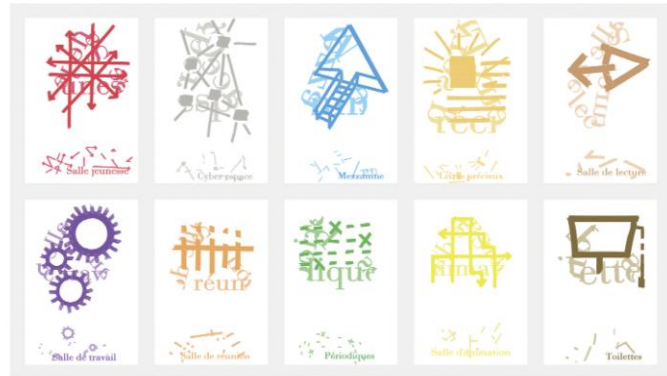
Плакат Ксав'є Жилліо «Бібліотека» наводиться за згодою автора

Бельгійський мандрівник і художник-дизайнер Ксав'є Жилліо, відомий своєю участю у міжнародному автомобільному арт-турі «Bruxelles Artok Tour», маршрут якого проходив через Харків, створив плакат, на якому була зображена його авторська образно-концептуальна репрезентація бібліотеки як місця пізнання, спілкування та інтелектуальних практик [Філософія мови, 2004, с. 39]. Плакат складається