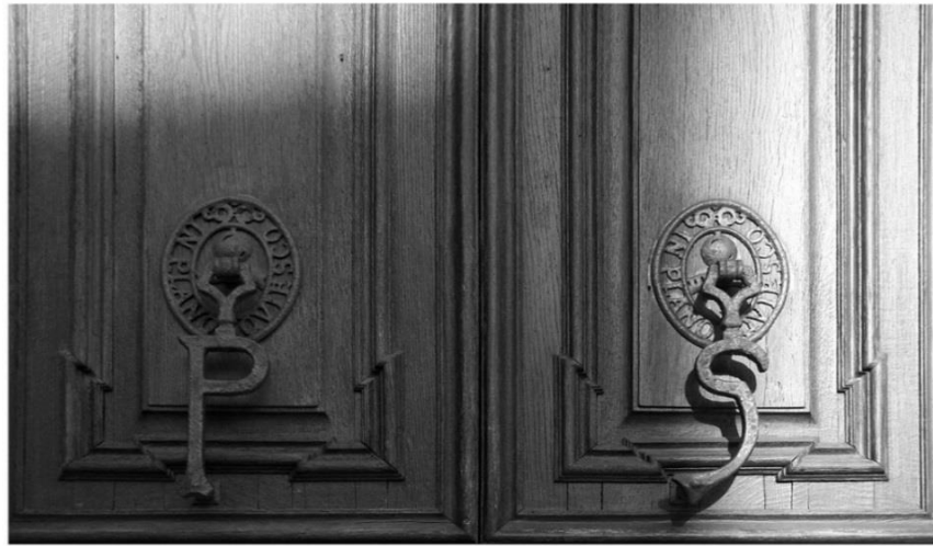
ДВЕРІ ДО МИНУЛОГО

Спостерігання, Трансцендування, а також Фотофіксація-та-Осмислення є, на мій погляд, важливими складовими сучасної філософської мандрівки як інтелігібельного феномену.