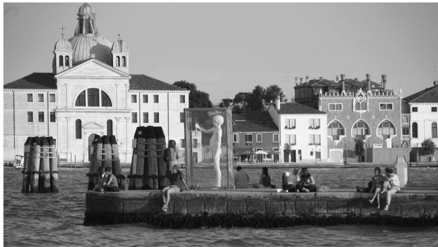
МАНДРІВНИЙ ФІЛОСОФ СПОГЛЯДАЄ

Венецію й сучасних мандрівників. В серії з двадцяти репортажних фотографій, які було створено у 2010 році та відредаговано/названо у 2022 році, демонструється збірний образ сучасного мандрівного філософа й філософині, які сприймають і фіксують сенсовміщуючі фрагменти реальності та вступають, таким чином, у діалог з Історією. Це фото показує людину, що спостерігає/розмислює в оточенні п'яти пар, які спілкуються. Головний герой зосереджений, а за спиною в нього знаходиться скульптура, яка, у контексті візуальної філософії цього кадру, на мій погляд, може втілювати образ його особистого несвідомого.