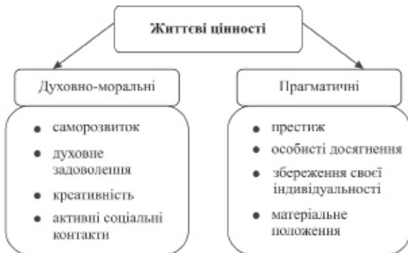
Рис.1. Структура життєвих цінностей за В.Ф. Соповим, Л.В. Карпушиною

У дослідженні застосовано «Морфологічний тест життєвих цінностей» (МТЖЦ) В.Ф. Сопова, Л.В. Карпушиної [3], призначений для виявлення мотиваційно-ціннісної структури особистості (рис. 1).