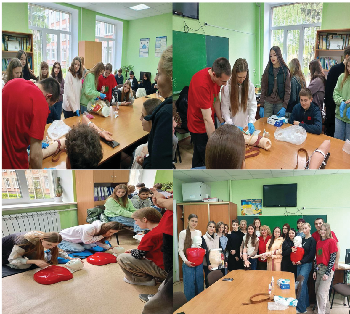
Рисунок 4. Оф-лайн тренінг «Перша допомога рятує життя» з учнями 9 та 11 класів Харківського ліцею № 49. Figure 4. Offline training “First Aid Saves Lives” with 9th and 11th grade students of Kharkiv Lyceum № 49.

Захід об'єднав ліцеїстів та здобувачів освіти ХНМУ навколо спільної мети: популяризації культури здоров'я серед молодого покоління. Протягом заходу обговорювали основні принципи здорового способу життя