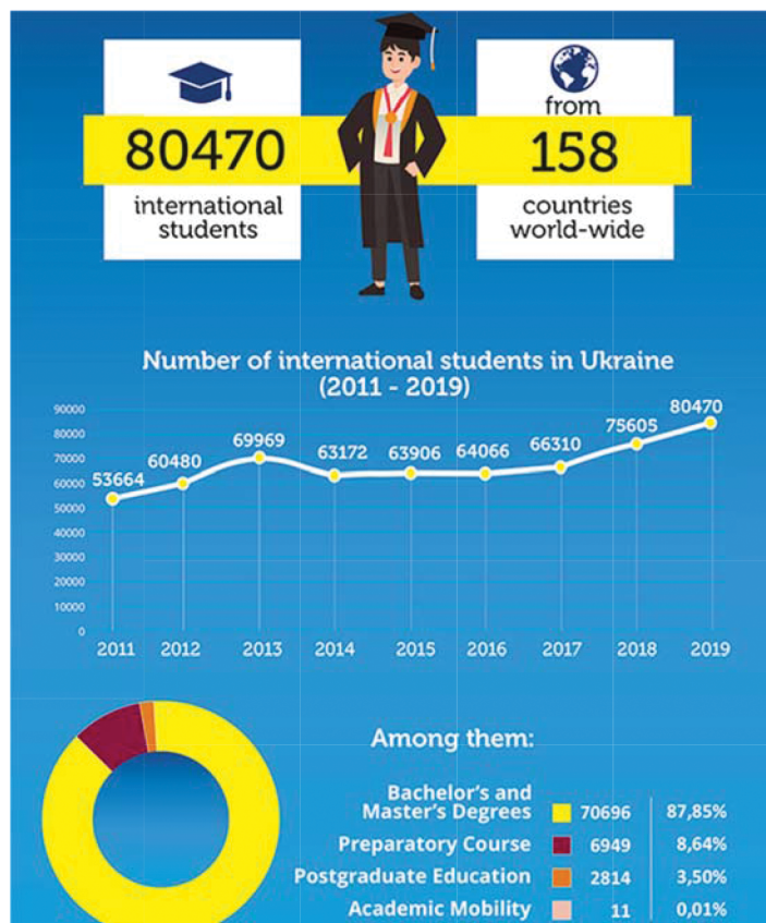
Рис.2. Кількість іноземних студентів, які навчаються в українських університетах / Number of foreign students studying at Ukrainian universities [16].

мі освіти. Зосередимо увагу на такому аспекті глобалізаційних процесів, як залучення іноземних студентів. Після розпаду СРСР в Україні залишилася низка провідних університетів з відмінною репутацією у світі та низькими цінами на навчання. Цей ресурс українська система освіти використовує і сьогодні особливо в галузі медицини. За даними Міністерства освіти і науки України, на момент 2019 року в Україні на різних рівнях вищої освіти навчалось 80 470 студентів (рис. 2.) з різних країн і вони сукупно приносили понад 3 мільярди доларів за своє навчання [16]. У 2021 році у ЗВО України навчається понад 76 000 іноземних студентів зі 155 країн світу і це число продовжує зменшуватися, що негативно впливає на культурну та академічну взаємодію українських університетів з іноземними колегами, а також негативно впливає на їхнє фінансове благополуччя.