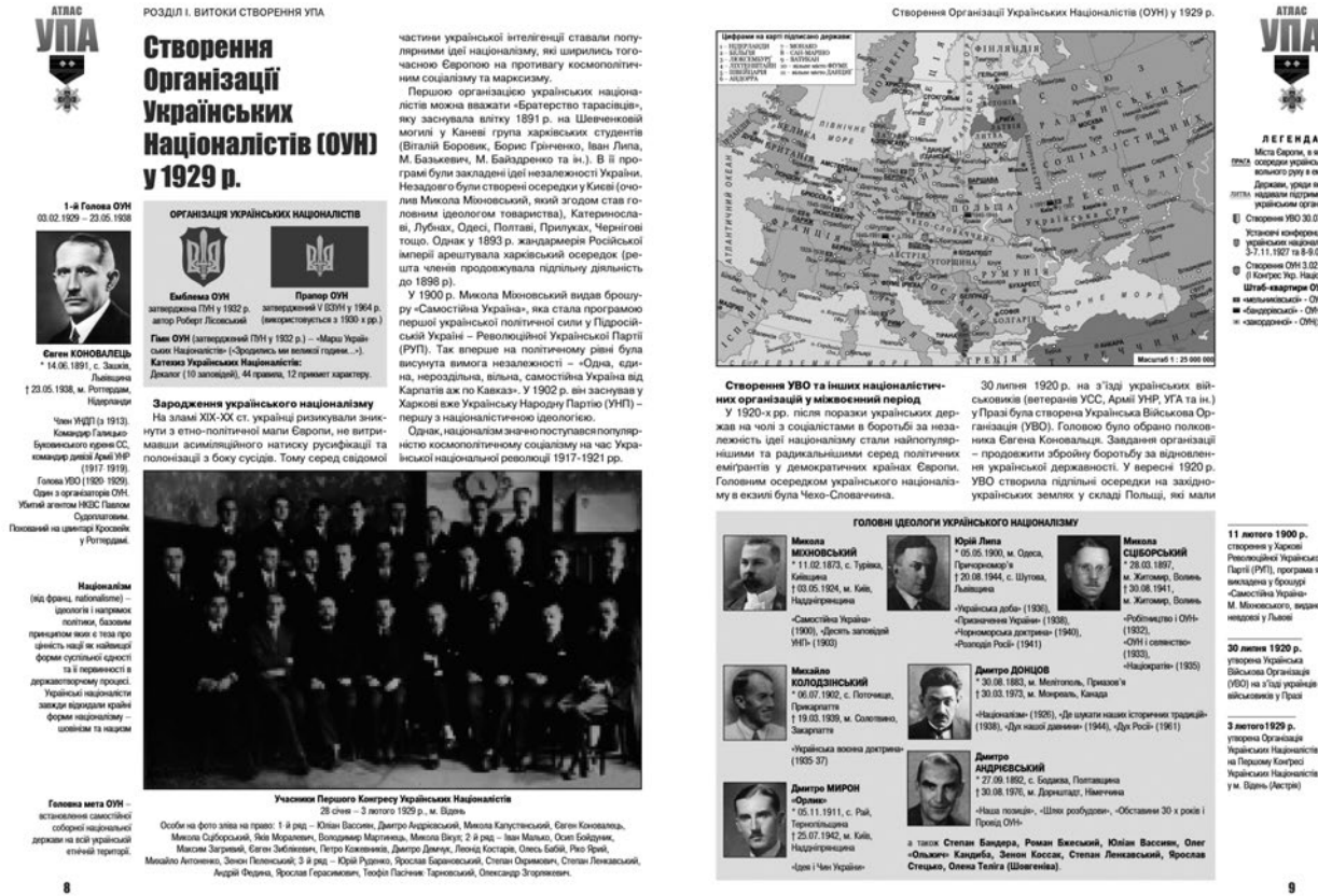
Рис.2. Карта-стаття «Створення Організації Українських Націоналістів (ОУН) у 1929 р.». Зразок оформлення