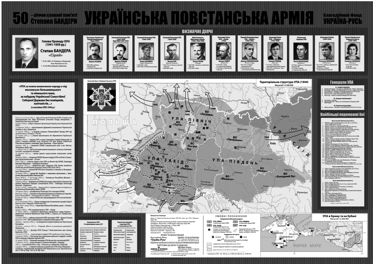
Рис.1. Карта «Українська Повстанська Армія» [8]