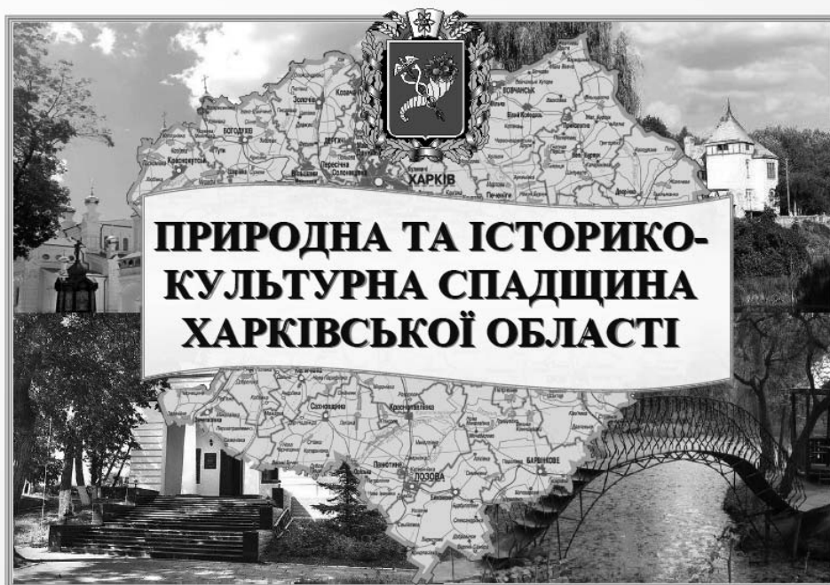
Рис. 1. Титульний аркуш атласу «Природна та історико-культурна спадщина Харківської області»