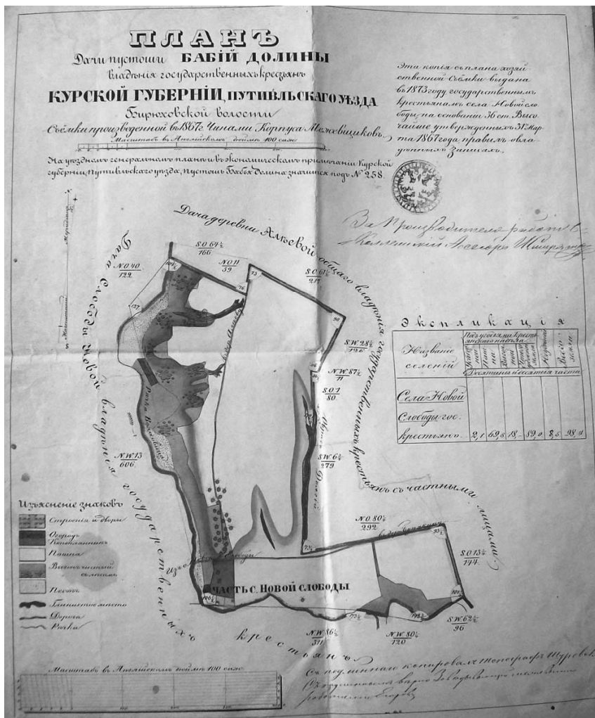
Рис. План дачі пустоші Бабій Долини (1873 р.)