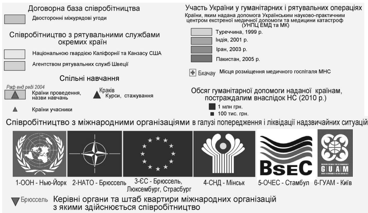
Рис. Легенда карти «Міжнародна діяльність України в галузі попередження і ліквідації надзвичайних ситуацій»

Рецензент – доктор географічних наук, професор Т.І. Козаченко