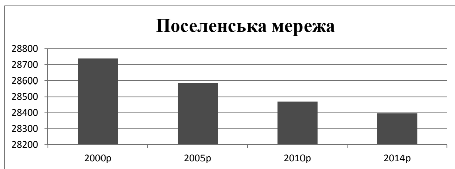
Рис.1. Скорочення поселенської мережі України

Зовнішні міграційні процеси в розрізі областей демонструють попит іноземців на проживання у конкретній області та бажання серед її мешканців виїхати за межі України. Серед обох категорій населення найбільш популярними серед мігрантів є Харківська область та місто Київ. Найбільшими автохтонами є мешканці Рівненської та Хмельницької областей, а найменше іноземців прагне оселитися на Тернопільщині та Закарпатті. Найбільший міграційний приріст (в особах) був характерний для Києва (12939), Харківської (7827), Чернівецької (1279), а також Волинської і Дніпропетровської областей [1].