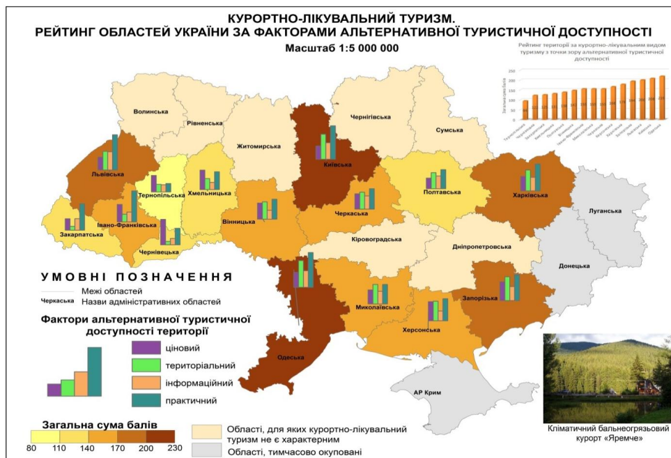
Рис.3. Рейтинг областей України за факторами альтернативної туристичної доступності курортно-лікувального туризму