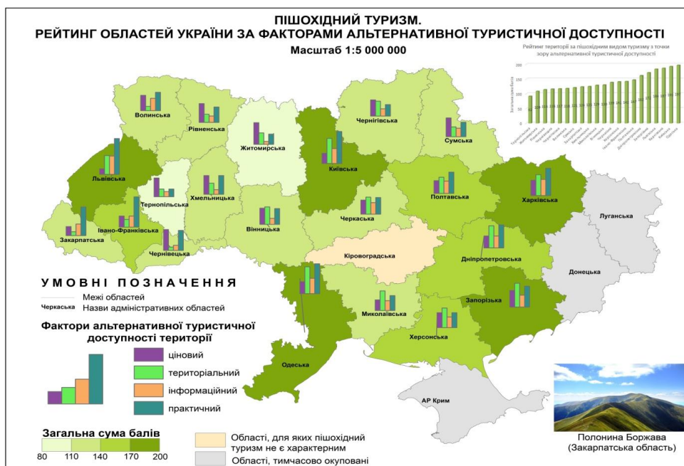
Рис. 6. Альтернативна туристична доступність областей України в аспекті пішохідного туризму

Висновки з даного дослідження і перспективи подальших пошуків. Геопросторово-картографічний аналіз сумарного рейтингового показника альтернативної туристичної доступності областей України у порівнянні одна з одною за виділеними видами туризму, обрхованого за принципом суми місць, за ціновим, територіальним, інформаційним, практичним факторами довів майже абсолютне лідерство Київської області за культурно-розважальним, релігійним, пізнавальним видами туризму та Одеської області за курортно-лікувальним і пішохідним видами туризму. Визначальними критеріями при цьому стали розвинена інфраструктура, територіальна доступність, популяризація і просування тематичних туристичних продуктів та об'єктів, на основі яких вони формуються. За результатами дослідження,