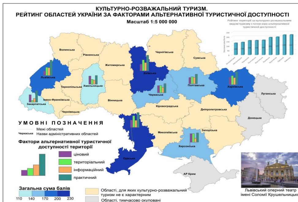
Рис. 4. Альтернативна туристична доступність регіонів України в аспекті розвитку культурно-розважального туризму

Черкаська область за сумарним рейтингом замикає першу десятку і поступилася адміністративним одиницям з більш розвинутою туристичною інфраструктурою та вдалішим географічним положенням щодо транспортних вузлів. В аспекті розвитку релігійного туризму для визначення альтернативної туристичної доступності враховуємо такі тематичні показники, як середня вартість подорожей з релігійною метою (ціновий фактор альтернативної туристичної доступності), поширення