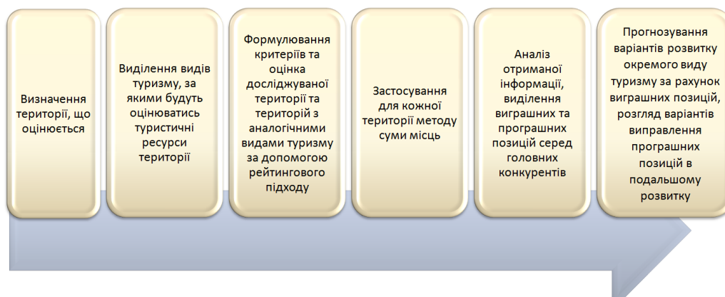
Рис. 1. Модель визначення альтернативної туристичної доступності

Виклад основного матеріалу. Геопросторово-картографічний аналіз туристичних можливостей на основі альтернативної туристичної доступності виступає початковим етапом розробки регіонального плану / стратегії розвитку туризму і передумовою проведення SWOT-аналізу, дозволяє наочно відобразити туристичний потенціал з точки зору можливостей вибору території для відпочинку, надає можливості якісніше впроваджувати туристичну діяльність (рис.1).