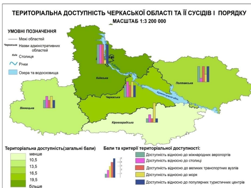
Рис.2. Територіальна доступність Черкаської області та її сусідів I порядку (масштаб зменшено)

Для оцінювання природно-рекреаційного чинника формування інформаційної доступності були