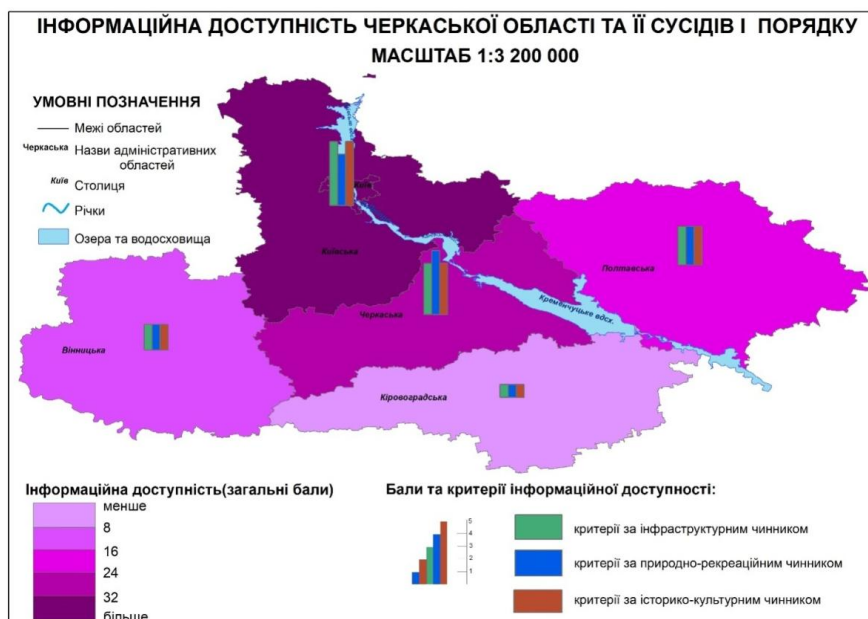
Рис.4. Інформаційна доступність Черкаської області, її сусідів І порядку (масштаб зменшено)

Так, для інфраструктурного чинника оцінювання буде проводитись за кількістю туристичних організацій на території, кількістю та різноманітністю