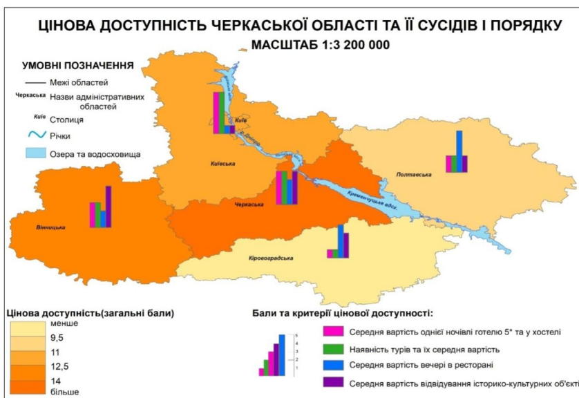
Рис.3. Цінова доступність Черкаської області та її сусідів I порядку (масштаб зменшено)