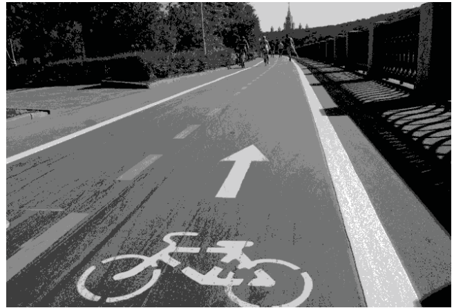
Рис. 2. Велостакада (ліворуч) та велодоріжка (праворуч)