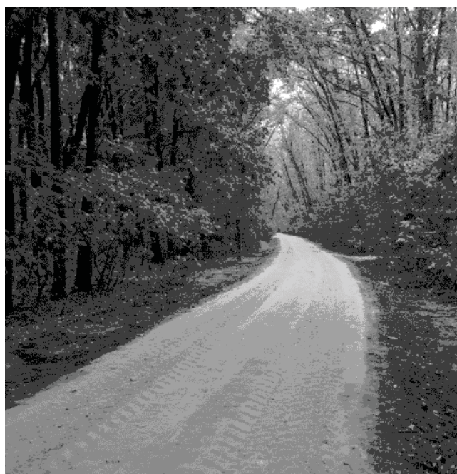
Рис. 1. Система велодоріжок у Лісопарку