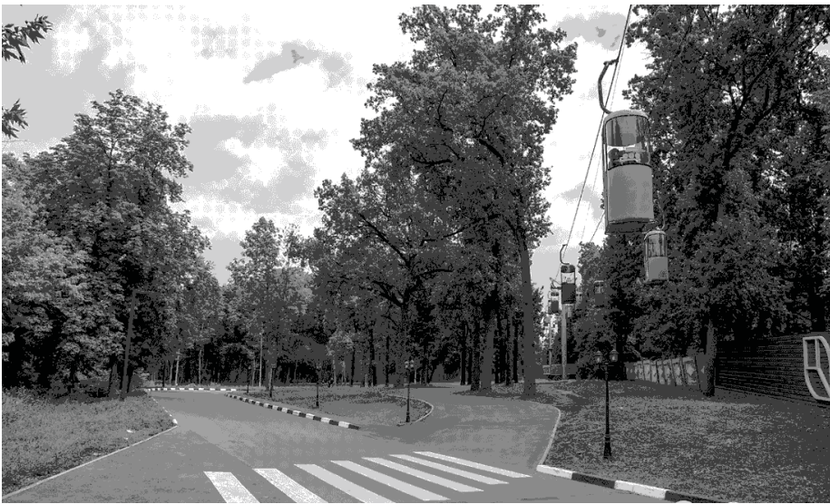
Рис. 3. Елементи з'єднання велодоріжок Саржиного Яру та парку імені М. Горького у єдину систему

У зоні дії велосипедних доріжок існує мережа станцій технічного самообслуговування на засадах безплатності, обладнаних мінімальним ремонтним набором і насосом, але таких станцій зараз по місту нараховується з десяток, проти 35 у Львові. Ще одним соціально-економічним питанням, що стосується можливостей організації веловідпочинку, є наявність пунктів прокату велосипедів (табл.2). У Харкові непогана мережа таких пунктів, хоча і є меншою, ніж в інших містах, де поширюється активне дозвілля з використанням велосипедів - у Львові, Києві, Вінниці, Івано-Франківську.