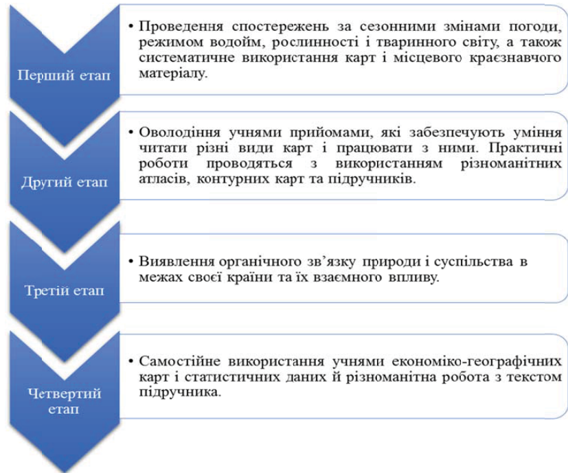
Рис.1. Етапи навчання географії (за [13])

На основі проведеного аналізу і виділення певних вимог до робіт та їх методичного забезпечення на кафедрі фізичної географії та картографії Харківського національного університету імені В.Н. Каразіна розроблена система практичних робіт з географії для 11-го класу (рівень стандарту). Пропоновані практичні роботи мають однакову структуру. Кожна містить мету, очікувані результати навчання, далі йде інформація про обладнання, після пропонуються для ознайомлення вичерпні теоретичні