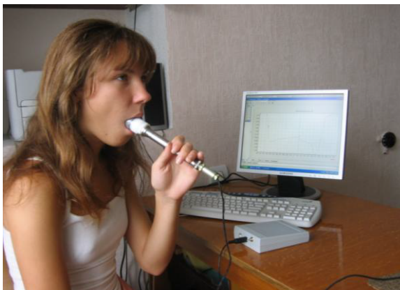
Рис. 1. Проведення експерименту з дослідження видихуваного газу хворого за допомогою сенсорів

манді дослідника хворий брав в рот мундштук з вмонтованим всередині сенсором, на який одягалась змінна насадка (рис. 1). При контакті газочутливого матеріалу сенсора з ВП людини змінюється його електропровідність. Даний ефект відображається на екрані монітору у вигляді кривої, що являє собою залежність падіння напруги на сенсорі від часу. Результати вимірів автоматично реєструються в комп'ютері.