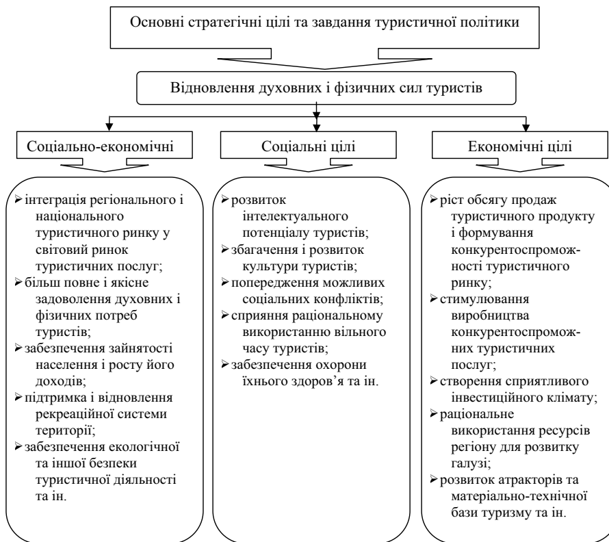
Рис. 2. Цільова структура туристичної політики

У даному випадку на першочергову увагу заслуговують такі групи показників