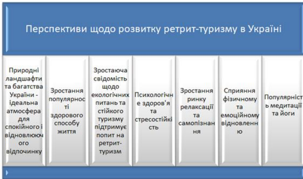
Рис. 6. Перспективи розвитку ретрит-туризму в Україні Розроблено авторами