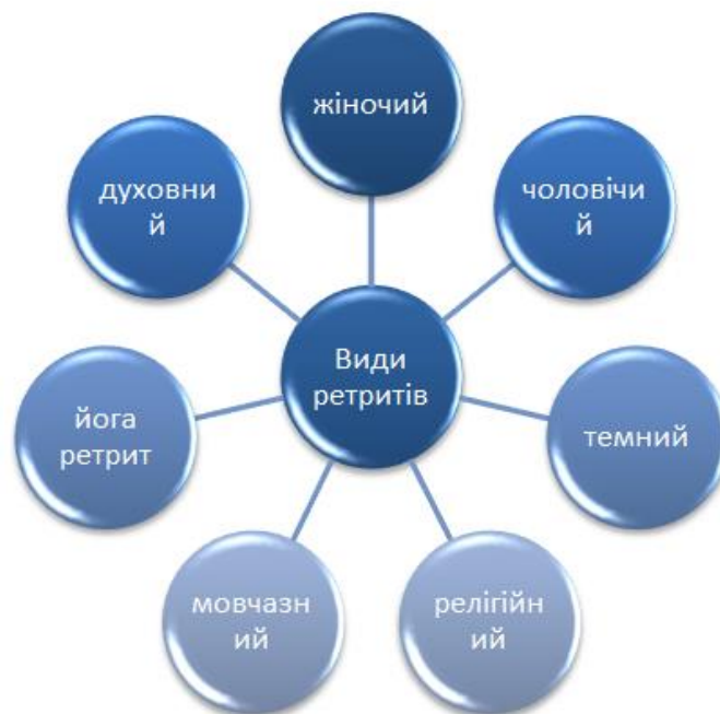
Рис. 2. Популярні види ретритів Розроблено авторами за матеріалами: [4] Fig. 2. Popular types of retreats Developed by the authors based on the materials: [4]