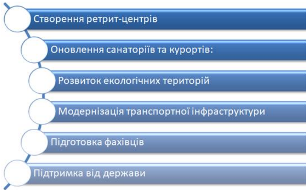
Рис. 8. Ключові аспекти розвитку інфраструктури ретрит-туризму в Україні Розроблено авторами Fig. 8. Key aspects of retreat tourism infrastructure development in Ukraine Developed by the authors

торної підтримки та створення сприятливого середовища для розвитку цієї галузі. Держава може встановлювати стандарти якості для ретрит-центрів і надавати сертифікати якості тим закладам, які відповідають цим стандартам. Це допоможе за-