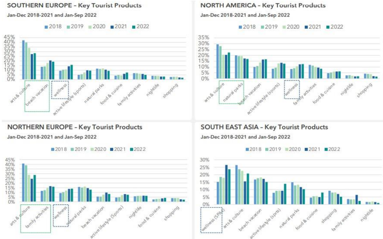
Рис. 3. Найкращі регіони світу з оздоровчого туризму [7] Fig. 3. The best regions of the world for health tourism [7]