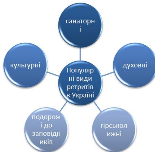
Рис. 4. Найпопулярніші напрями ретрит-туризму в Україні Розроблено авторами за матеріалами: [2] Fig. 4. The most popular retreat tourism destinations in Ukraine Developed by the authors based on the materials: [2]