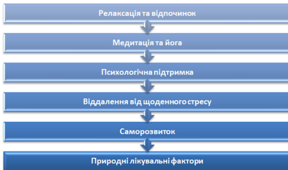
Рис. 7. Ключові аспекти позитивного впливу ретрит-туризму на психологічне здоров'я Розроблено авторами