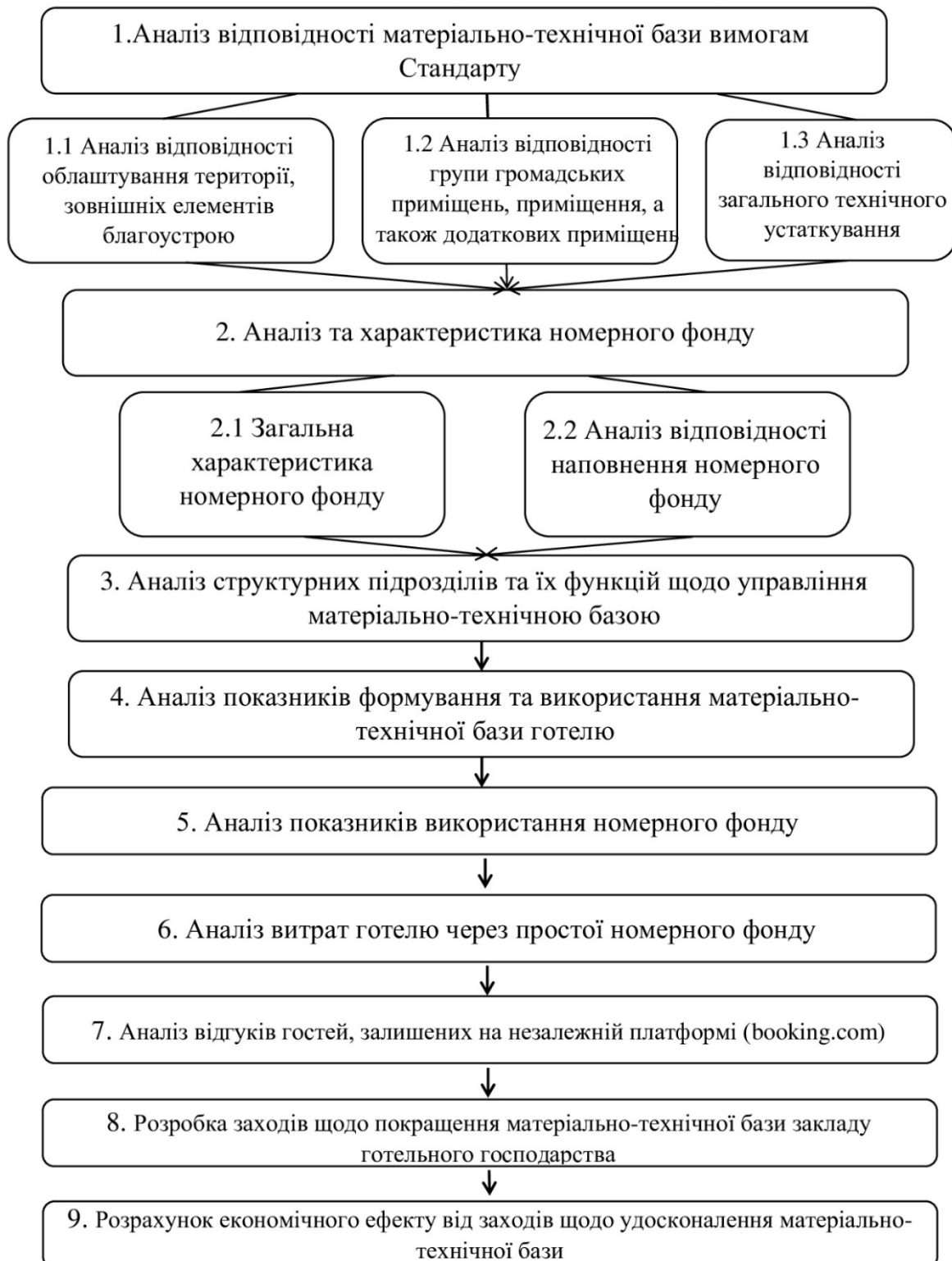
Рисунок 4. Методика аналізу ефективності формування та використання матеріально-технічної бази закладу готельного господарства