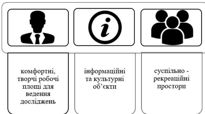
Рис. 4. Зміст креативних просторів* *Складено авторами за джерелом: [2]

– інформаційні та культурно-просвітницькі установи, що пропагують та впроваджують інформацію, науку та знання в усі види людської діяльності;