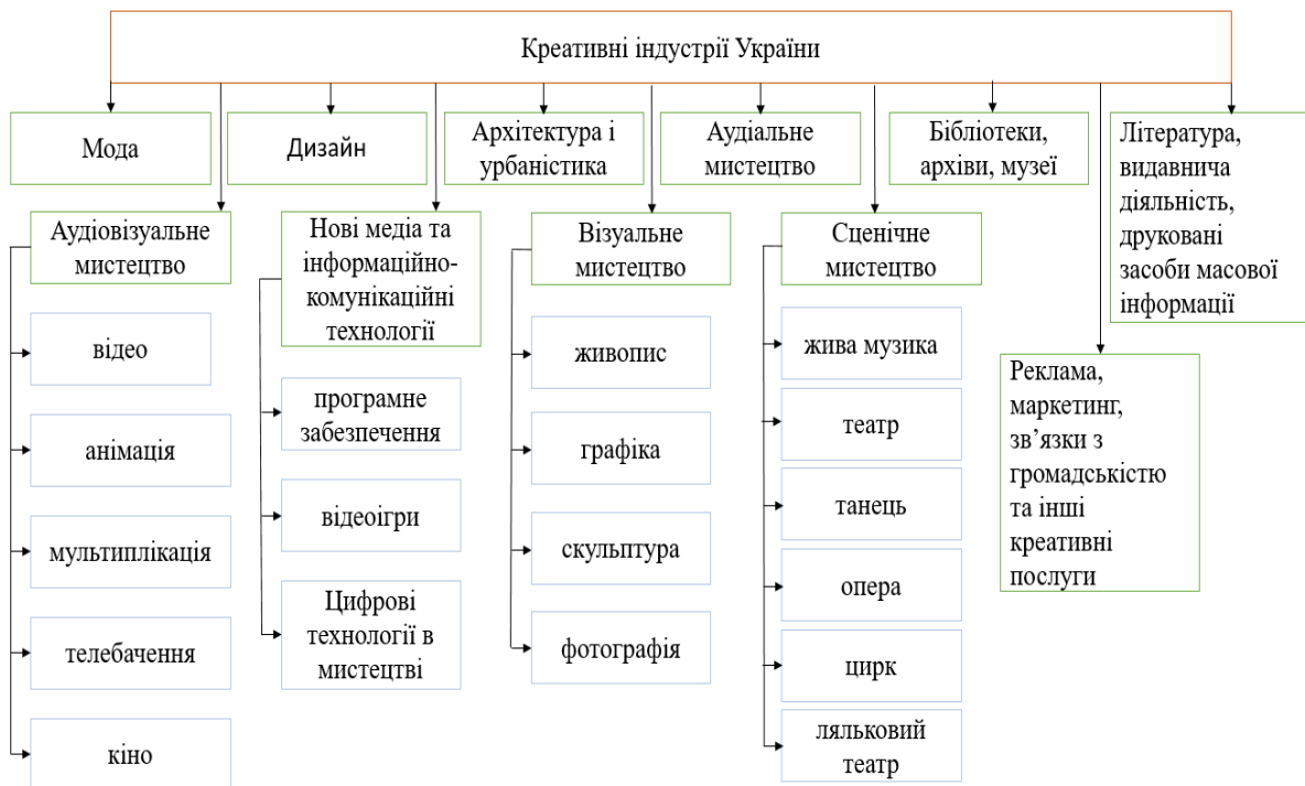
Рис. 3. Класифікація творчих індустрій згідно з законом України*

Складено авторами за джерелами: [6, 14, 15]