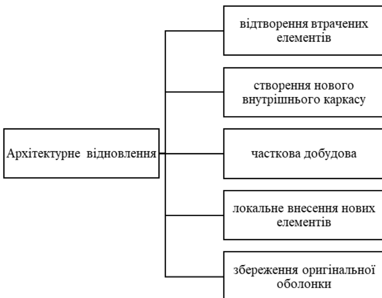
Рис. 5. Напрямки архітектурного відновлення споруд* *Складено авторами за джерелом: [16]