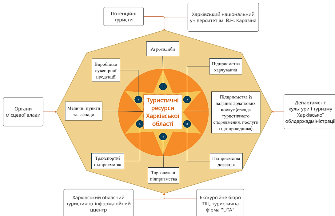
Рис. 4. Структура агротуристичного кластера «Слобожанська казка». Складено авторами

Крок 1 – формування ініціативної групи з числа зацікавлених учасників. Для створення кооперації необхідний пошук майбутніх партнерів зі схожими