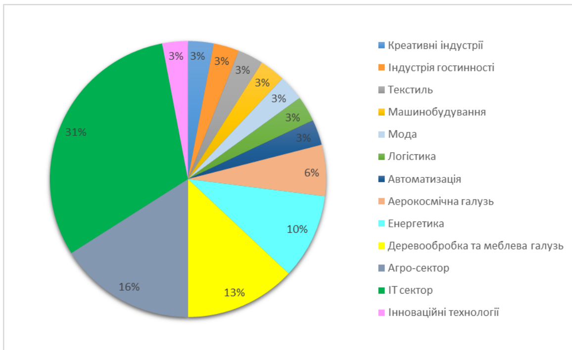
Рис. 2. Розподіл кластерів України за видами економічної діяльності. Створено авторами за джерелом: [7]