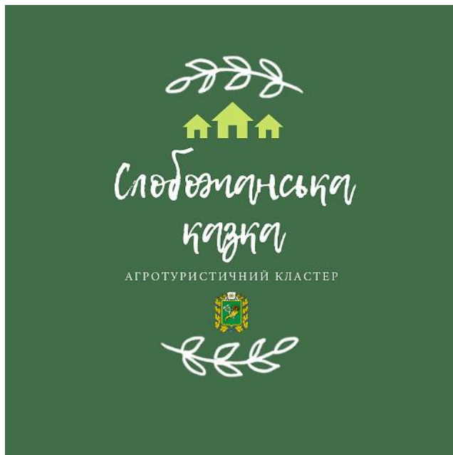
Рис. 5. Логотип агротуристичного кластеру «Слобожанська казка» Складено авторами

дальність [5]. На рис. 5 нами представлено логотип майбутнього утворення.