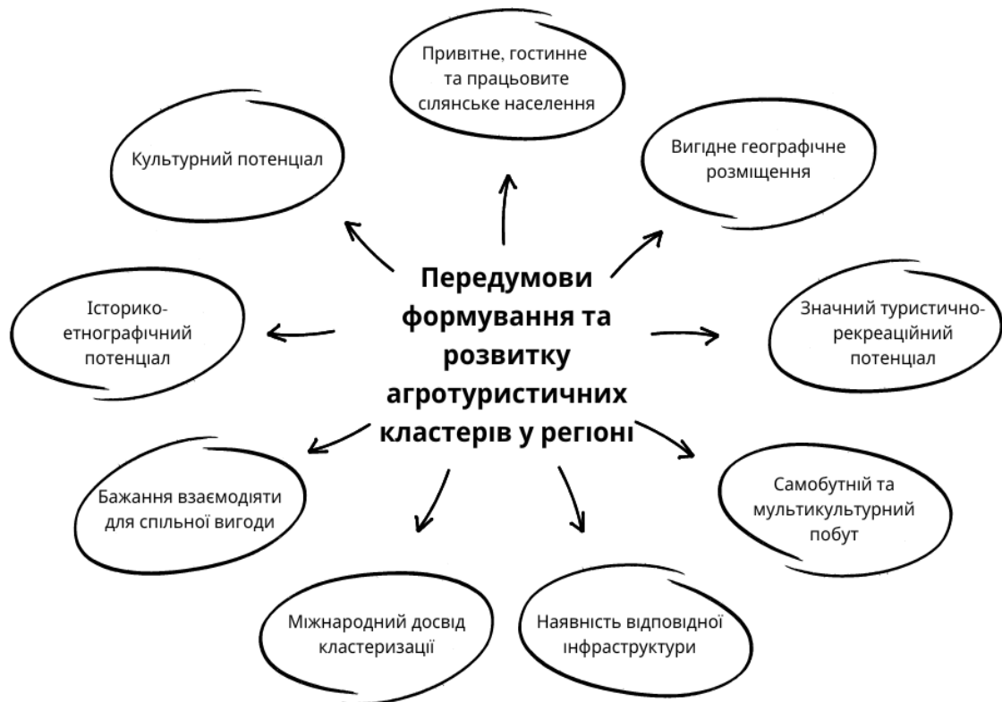
Рис. 1. Передумови формування та розвитку агротуристичних кластерів у регіоні. Складено авторами за джерелом: [4]