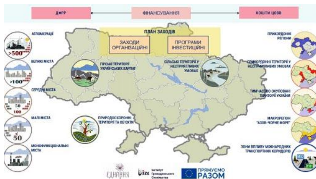
Рис. 3. Загальний огляд територіальної орієнтації ДСРР-2027 [1]