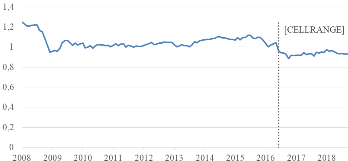
Рис. 1. Курс фунта стерлингов за период 2008-2018 гг.* *построен авторами по материалам: [20; 26]

других исследованиях поддерживается мысль о том, экономическая выгода играет меньшую роль в объяснении отношения к иммиграции, чем опасения относительно того, как иммиграция затрагивает нацию в целом [13; 17].