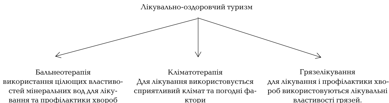
Рис 1. Структура комплексу лікувально-оздоровчого туризму [4]

Нині основами лікувально-оздоровчого туризму є бальнеотерапія (коли лікувальний ефект досягається за рахунок впливу цілющих властивостей мінеральних вод), кліматотерапія (сприятливі погодні фактори та властивості клімату) та грязелікування (використовуються лікувальні грязі).