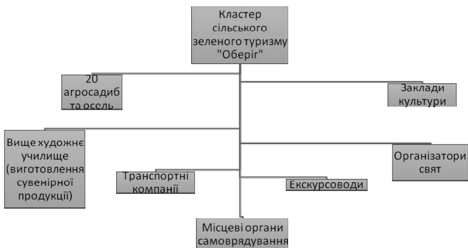
Рис. 2.2. Організаційна структура кластеру сільського туризму «Оберіг»

На Тернопільщині в Бережанському районі з 2007 року існує туристичний кластер «Мальовнича Бережанщина», що створений Бережанською районною громадською організацією. Кластер створено з метою комплексного розвитку сільського зеленого туризму в районі, економічного та соціального розвитку сільської місцевості. Основними напрямками своєї діяльності кластер виділяє розробку проектів та стратегій розвитку сільського зеленого туризму в районі, проведення заходів для популяризації Бережанського району (відкрито туристично-інформаційний центр у 2013 р.), участь у туристичних виставках та ярмарках. На сьогоднішній день до кластеру входять всього 4 агросадоби, де туристи мають змогу отримати послуги сільського зеленого туризму: садиба «У мальвах» (с.Жуків), садиба «Курянівська» (с.Куряни), садиба «Медвідь» (с.Шибалин) та «Залісся» (м.Бережани). Агросадоби пропонують не тільки послуги розміщення, але й екскурсійні послуги, риболовство, збиральництво грибів та ягід в лісах. Рівень наданих послуг в садибах досить високий, але через брак інформаційного забезпечення, туристами є лише жителі найближчих селищ та міст.