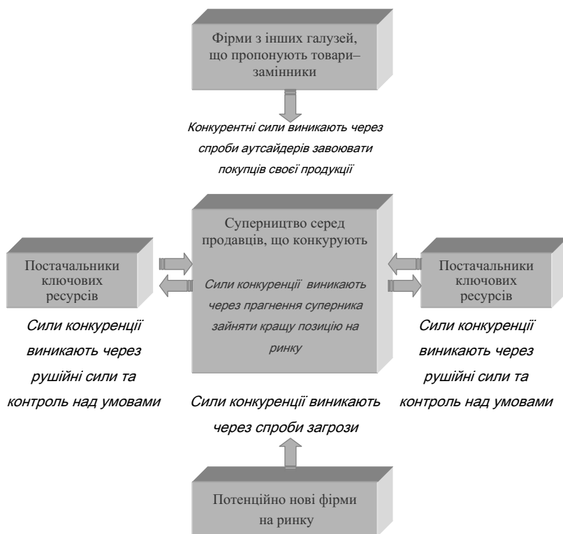
Рис. 1. Модель п'яти сил конкуренції. Складено автором за матеріалами: [12]

Забезпечення ефективного конкурентного середовища для будь-якої відкритої економічної системи