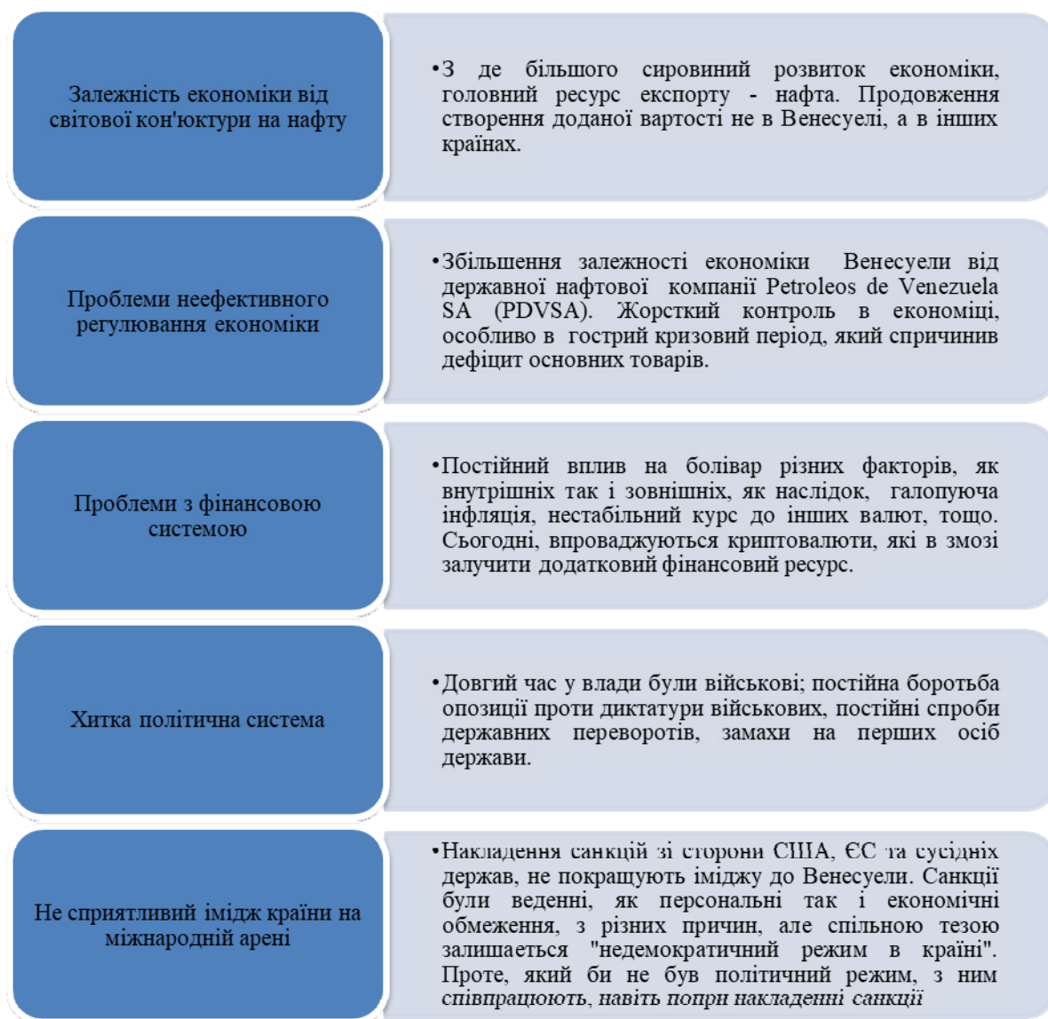
Рис. 2. Головні причини структурної економічної кризи в Венесуелі * Складено авторами

економічних проблем в країні та проведення більш ефективної політики, щодо зменшення залежності від експорту нафти, подальші коливання на світових ринках нафти можуть ще гостріше вплинути на економічний розвиток Венесуели.