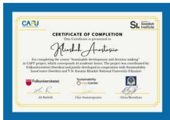
Рис. 2 – Сертифікати за участь в онлайн частині проєкту SAFU [3] Fig. 2 - Certificates for participation in the online part of the SAFU project [3]

В рамках освітнього візиту, який відбувся з 28 жовтня по 1 листопада 2024 року учасники проєкту мали низку освітніх і культурних заходів (рис. 3). Під час освітньої частини проєкту був інтенсивний курс лекцій, присвячених сталому розвитку, управлінню проєктами та формуванню ключових компетенцій. В рамках лекцій відбулось знайомство з системою освіти в Швеції та окремо – з системою Learning in Work; визначити спільні та відмінні риси з в освітньому процесі та застосуванні інноваційних підходів у навчанні студентів у Швеції та Україні. Важливою складовою навчання стали тренінги провідного фахівця проєктного менеджменту Алі Рашиді зі створення власних проєктів. Окремий блок лекцій був присвячений досвіду Швеції у сфері поводження з відходами. В межах навчального візиту учасники відвідали провідні освітні та інноваційні установи та організації в містах Уппсала та Стокгольм. Учасники відвідали