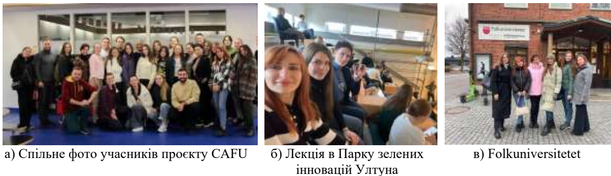
Рис. 3 – Участь в навчальному візиті по проєкту CAFU [4] Fig. 3 - Participation in the CAFU study visit [4]

Проєкт CAPABLE (Common Academic Practices and Abilities in Learning for Research) програми SI Baltic Sea Neighbourhood спрямований на надання знань, навичок та можливості для налагодження контактів аспірантам, які захищають свої дисертації в університетах, що входять до мережі BUP (Балтійська університетська програма), і зосереджуються на темах сталого розвитку. Учасники заходів цього проєкту отримують менторську підтримку та зворотний зв'язок щодо своїх дисертацій, а також тренінги з академічного розвитку, зокрема з академічного письма, підготовки презентацій, розвитку критичного мислення, розробки наукових аргументів тощо.