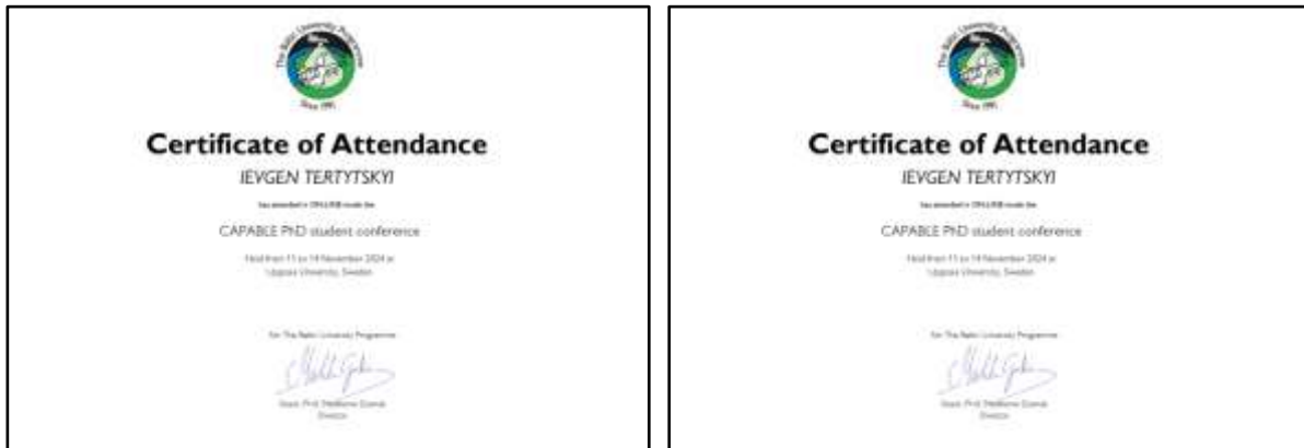
Рис. 5 – Сертифікати за участь в проекті CAPABLE Fig. 5 - Certificates for CAPABLE project participation

ності теми дослідження, а також навичок академічного письма. Також, програма конференції включала можливість відвідування воркшопів із дизайн-мислення, практичних сесій з підготовки наукових презентацій та публікацій, воркшопу з пошуку міждисциплінарних зв'язків наукових досліджень, неформальні заходи з нетворкінгу із місцевими аспірантами та дослідниками. За результатами учасники отримали сертифікати (рис.5).