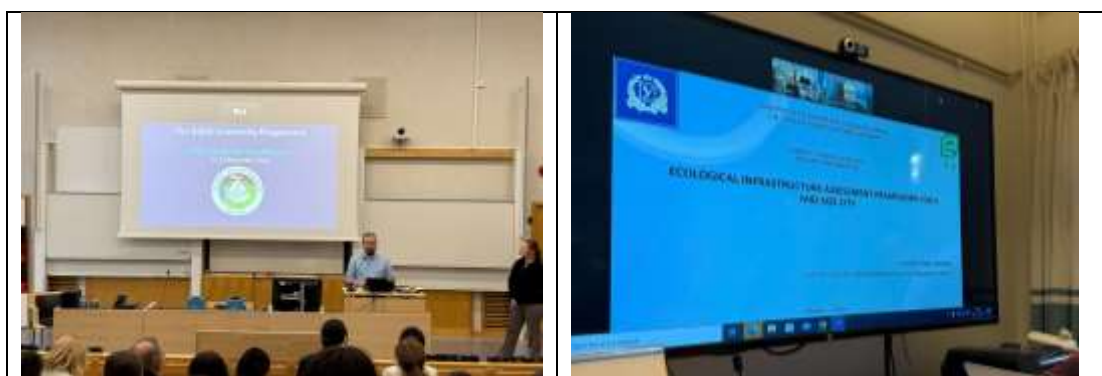
Рис. 4 – Семінари та комбіновані виступи учасників конференції проєкту CAPABLE Fig. 4 - Seminars and combined online presentations of CAPABLE project participants

На першому етапі участі в проєкті учасники відвідали серію з чотирьох навчальних семінарів. Семінари були присвячені широкому колу питань, зокрема, висвітленню тем з розвитку академічного письма для PhD-студентів, опануванню методів досліджень, важливості впровадження стартапів та інновацій у ході підготовки наукових статей до публікації, можливостей та обмежень у використанні штучного інтелекту в підготовці текстів, тощо (рис.4). Двогодинні онлайн-семінари вдало комбінували елементи теоретичних лекцій з дискусійними активностями та практичними завданнями, що дало змогу учасникам не тільки дізнатися про прийоми покращення навичок написання наукових робіт та їх презентації, а й, що є особливо цінним, отримати персональні поради як найкраще презентувати результати своїх власних досліджень.