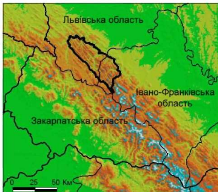
Рис.1 – Локалізація території дослідження – Сколівські Бескиди

ким чином, площа лісів, придатних для інтенсивної експлуатації, становить 29 % площі всіх лісів Сколівських Бескидів, або 17 % площі екорегіону. Серед лісів, придатних для інтенсивної експлуатації, найбільші площі займають похідні буково-(ялицево)-ялинові деревостани (17 048 га) стрімких схилів, великі масиви яких зосереджені на південному сході регіону у басейні верхів'я р. Мізунки. На північному заході Сколівських Бескидів невеликі осередки лісів можливої інтенсивної експлуатації розташовані на вершинах невисоких хребтів та спадистих схилах, це переважно вторинні буково-ялицеві та чисті ялинові деревостани.