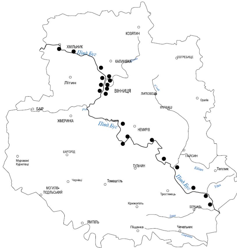
Рис. 1 – Місця відбору проб річки Південний Буг та його приток

п – нормальність трилону Б; К – поправка до розчину трилону Б по MgCl 2 ; 0,9843 для 0,05 н трилону Б; V – об'єм досліджуваної проби, взятої на титрування, мл(35-36). Класифікація жорсткості використана за методикою О. О. Алекіна: