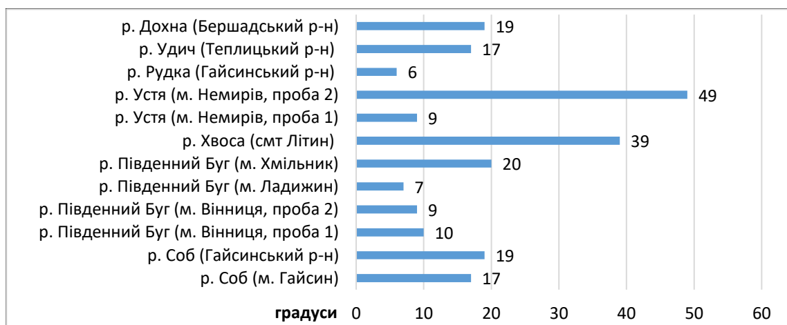
Рис. 3 – Кольоровість річкової води