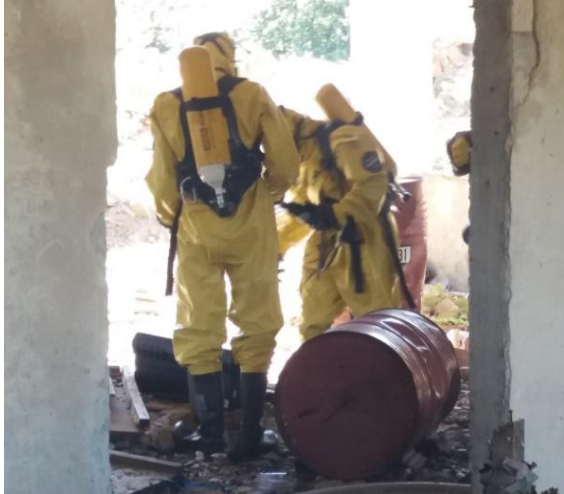
Рис. 6 – Робота групи відбору проб в засобах індивідуального захисту

Під час роботи з невідомими речовинами, необхідно використовувати автономні дихальні апарати (рис. 6) з газонепроникними захисними костюмами. Якщо небезпечна речовина і її характеристики відомі, рівень захисту може бути адаптований відповідно до вимог, що полегшить роботу персоналу.