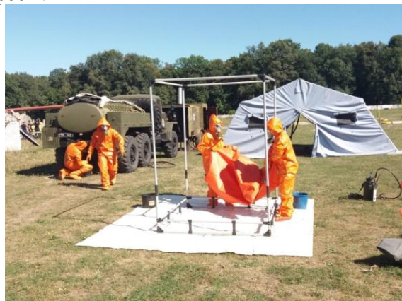
Рис. 2 – Група проведення деконтамінації

Розподіл завдань серед членів команди має відбуватися таким чином, щоб завжди був один «чистий» член команди (помічник). Член команди який збирає зразки (брудний) несе відповідальність за визначення пріоритетів місць (точок) відбору проб та швидке виконання цих робіт.