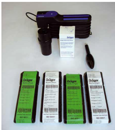
Рис. 5 – Ручний насос та індикаторні трубки

сильфони відпускаються, повітря автоматично прокачується, і зразок вимірюваного газу втягується через використовувану трубку.