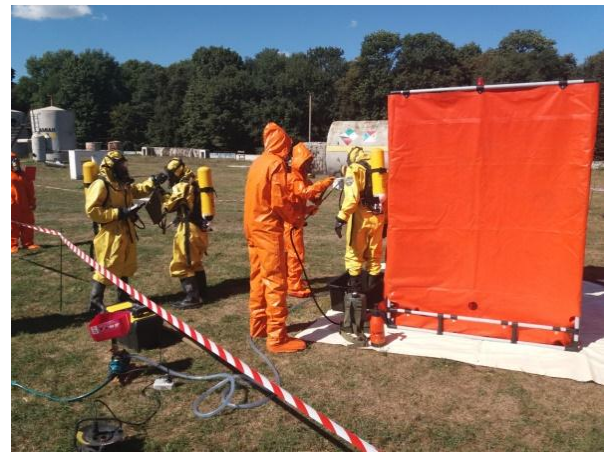
Рис. 7 – Проведення деконтамінаційної обробки захисного одягу групи відбору проб

матеріали для відбору проб, ретельна промивка теплою водою з дезінфікуючими засобами (поверхнево-активними речовинами) у багатьох випадках є найкращою рекомендацією рис. 7. Те ж саме відноситься до деконтамінації захисного одягу персоналу.