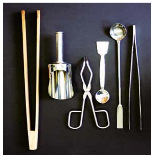
Рис. 4 – Інструменти для відбору проб (зліва направо): щипці великі, лопатка, кліщі тигельні, ложка-шпатель маленька, ложка-шпатель велика, пінцет

Якщо кількість підозрілої (небезпечної) речовини невелика, то цей матеріал проби повинен бути зібраний в скляну пляшку в повному обсязі. Якщо є достатня кількість матеріалу для зразка проби, необхідно помістити не менше 100 мл в скляну пляшку. Великі зразки проб повинні бути упаковані в контейнер (наприклад, пляшка об'ємом 500 мл). Лопаткою, ложкою або шпателем, можуть бути взяті порошкоподібні і пухкі зразки проб. Кліщі тигельні допомагають підібрати маленькі камені і предмети, пінцет використовується для ще більш дрібних предметів рис. 4. Якщо можливо, температуру всіх матеріалів слід перевіряти і записувати ці дані.