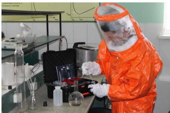
Рис. 1 – Відбір проб речовини для аналізу

Перед проведенням відбору проб, необхідно проаналізувати надзвичайну ситуацію [9, 10, 11]. За результатом аналізу, необхідно визначити план роботи. Метою операції є отримання додаткової інформації про надзвичайну ситуацію. Відбір проб, рис. 1, здійснюється для отримання інформації про безпеку речовини, передусім це вивчення зразків у лабораторії.