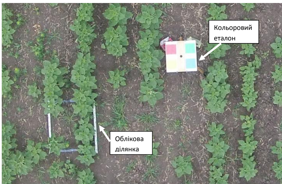
Рис. 1 – Фрагмент загального знімка досліджуваного поля (знімок з коптера DJI Phantom Vision 2+)

Для проведення обліку бур'янів традиційними польовими методами в протилежних частинах поля було створено дві облікові ділянки розміром 1x1 м. Поруч з ділянками на спеціальних штативах на висоті 1,5 м були встановлені кольорові еталони, призначені для врахування зміни освітлення під час зйомки (рис.1).