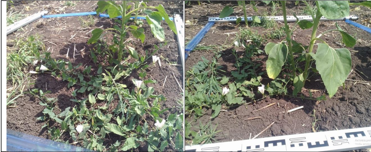
Рис. 2 – Вигляд облікової ділянки для підрахунку кількості бур'янів. Видно, що значна їх частина закрита від дистанційного спостереження листям соняшника

Облік бур'янів виконувався ваговим методом з урахуванням якісного складу бур'янів. Результати польових спостережень наведені у таблиці 1.