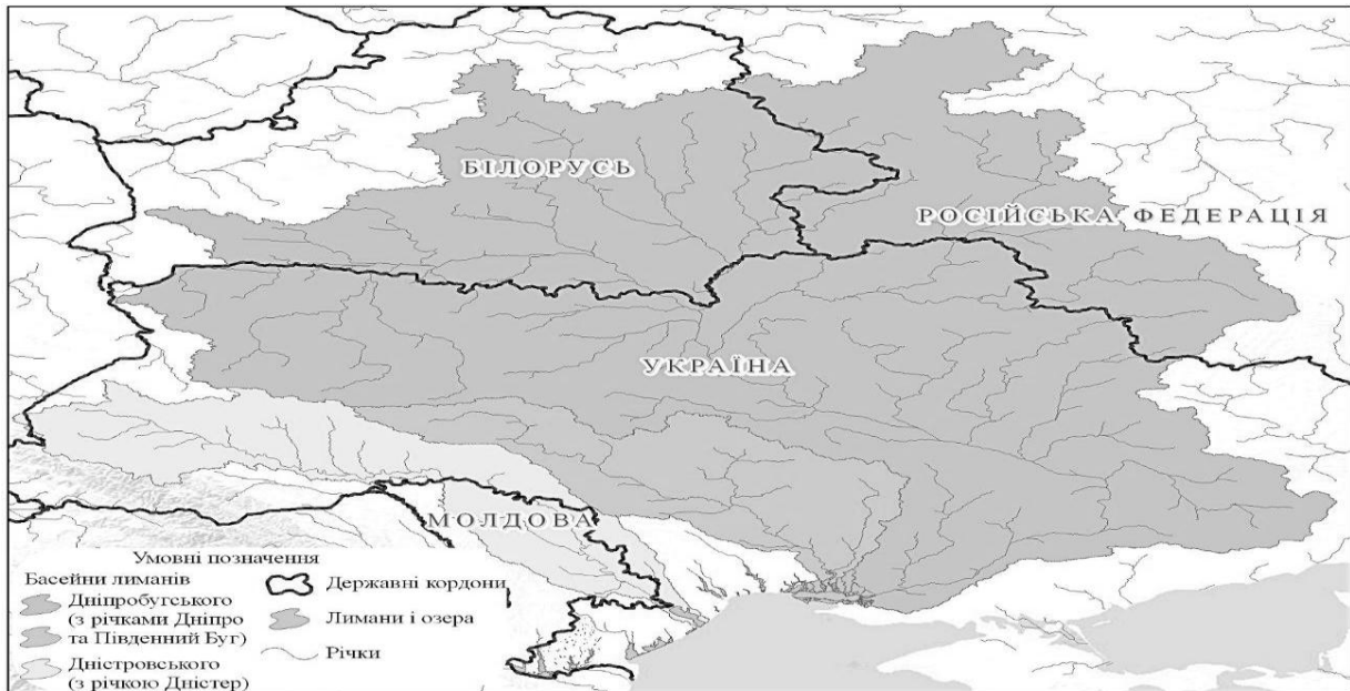
Рис. 2 – Басейни водозбору Дніпробугського і Дністровського лиманів (включаючи водозбірні басейни річок, які впадають у ці лимани)