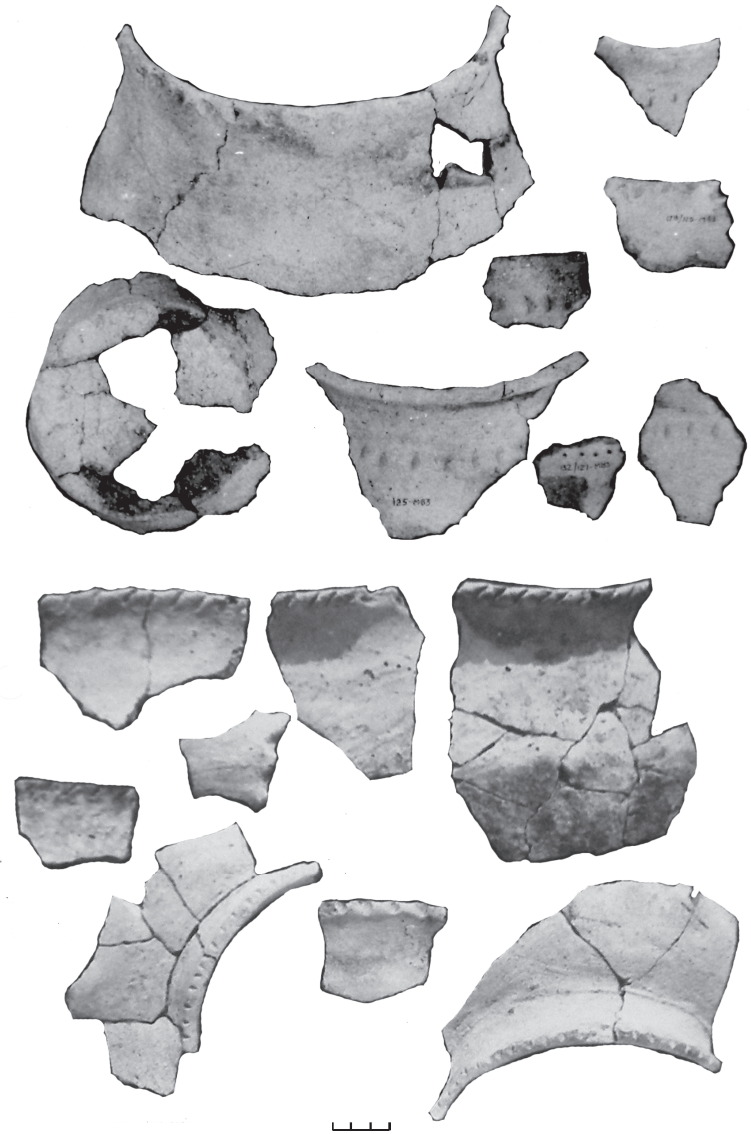
Рис. 3. Фрагменти ліпного посуду