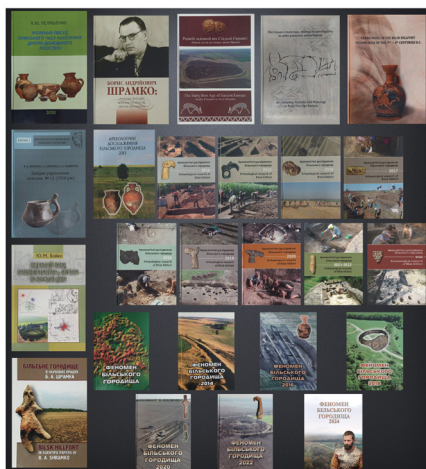
Рис. 3. Наукові видання, підготовлені спільною командою ІКЗ «Більськ» та Каразинського університету в період 2014–2025 рр.