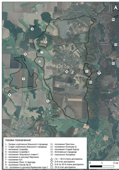
Рис. 1. Пам'ятки, досліджені в період 2005–2025 рр.