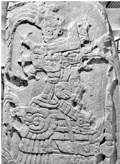
Лл. 5. Стела 9 з Тікаля. Портрет К'ан-Кітама як типового владаря майя. Fig. 5. Tikal Stela 9. Portrait of K'an Kitam as typical Maya lord.