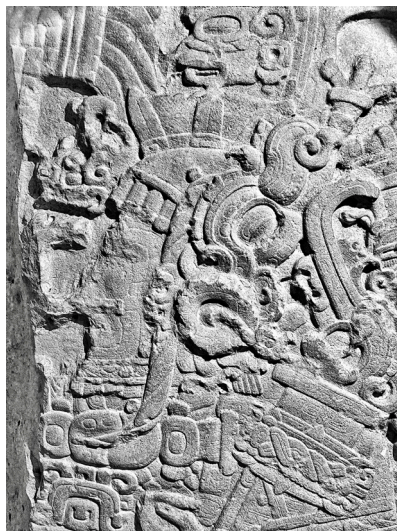
Лл. 4. Стела 40 з Тікаля. Портрет К'ан-Кітама у мексиканському головному уборі.