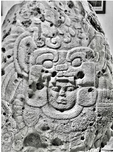
Іл. 1. Стела 4 з Тікаля. Портрет Йаш-Нуун-Ахііна I у мексиканському спорядженні.