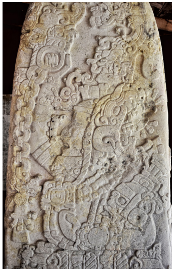
Іл. 2. Стела 31 з Тікаля. Лицьова сторона монумента з портретом Сіхйах-Чан-К'авііля II.