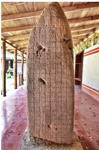
Лл. 3. Стела 31 з Тікаля. Тильна сторона монумента з ієрогліфічним текстом.