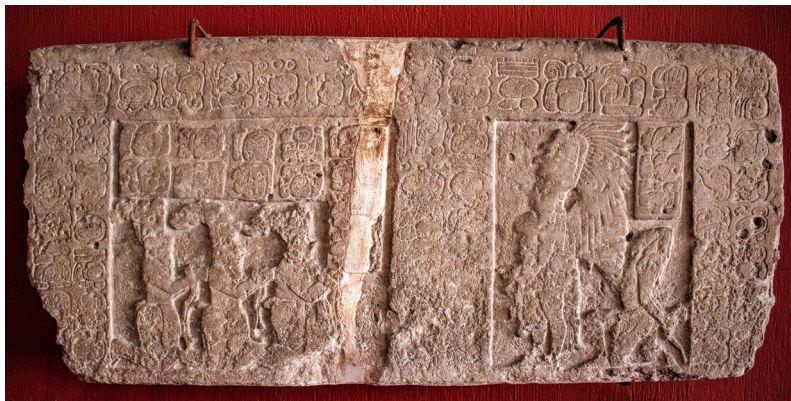
Іл. 7. Панель 12 із П'єдрас-Неграса.