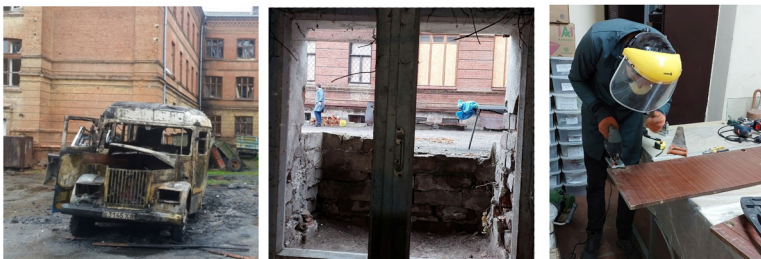
Фото 6. Закриття розбитих вікон у приміщеннях по вул. Трінклера, 8. Серпень 2022 р..

Отримавши в університеті декілька OSB-плит, співробітники музею змогли закрити найбільш вразливі ділянки руйнувань на першому поверсі, інші — лише целофаном. У весняно-літній період цього могло вистачити, проте було зрозуміло, що попереду осінь з дощами та зима з низькими температурами, холодними вітрами та снігом. Вставляти нові вікна, виходячи з реалій війни та фінансових обмежень, не мало сенсу, проте утеплювати приміщення та намагатись підтримувати в них мінімальну температуру для того, щоб можна було увімкнути опалення та зберегти колекції, архів та бібліотеку, — стало основною проблемою і завданням на поки ще віддалену перспективу.