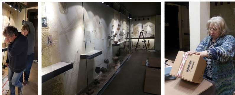
Фото 4. Демонтаж постійної музейної експозиції. Квітень 2022 р. (фото з архіву авторки).

перша гуманітарна допомога з пакувальними матеріалами 3 , було вирішено розібрати постійну експозицію (див. фото 4).