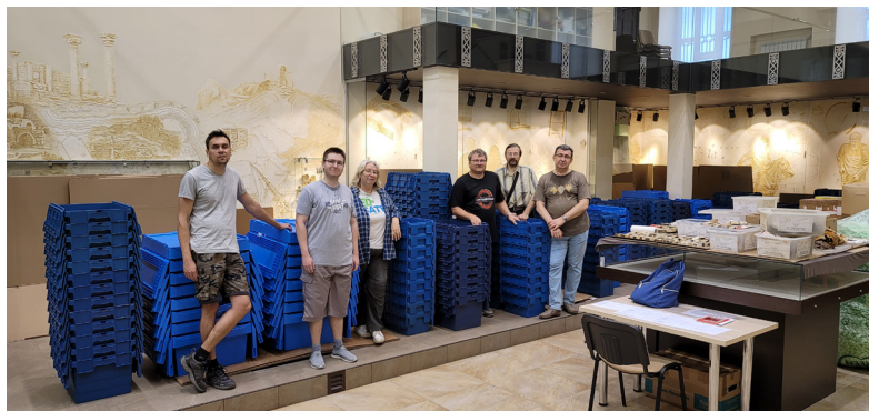
Фото 5. Перша частина гуманітарної допомоги, наданої ALIPH. Липень 2022 р. (фото з архіву авторки).

Поступово, протягом декількох днів, тривала робота з демонтажу вітринного скла та артефактів з кожного експозиційного блоку. Після пакування знахідок у підготовлені коробки колекції були перенесені в більш безпечне місце, а вітрини закриті картонними листами. Зазначимо, що найбільш рідкісні артефакти були демонтовані з вітрин ще напередодні війни, 23 лютого 2022 р.