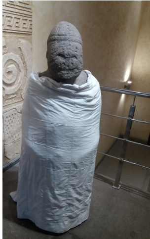
Фото 3. Копія кам'яної половецької «баби» біля входу до виставкової зали Музею. Березень 2022 р.