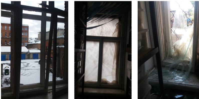
Фото 2. Музейні приміщення по вул. Трінклера після обстрілів у березні 2022 р. (фото з архіву авторки).

За відсутності необхідних ресурсів було вирішено тимчасово закрити вікна подручними засобами, використовуючи всі наявні матеріали (див. фото 2), зокрема старе експедиційне спорядження, щоб запобігти пошкодженню системи опалення та уникнути подальших руйнувань. Ці роботи проводили власними силами два співробітники, які залишились у Харкові, та волонтери. На той час відшукати додаткові будівельні матеріали або іншу допомогу не було можливим — йшли активні бойові дії, місто перебувало під постійними обстрілами та спробами штурмів.