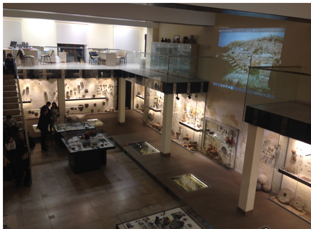
Фото 1. Виставкова зала Музею археології до війни.

У сучасній виставковій залі, урочисте відкриття якої відбулося 20 листопада 2015 р., розташована постійна експозиція і чотири модулі для розміщення тимчасових експозицій під час проведення виставок, які музейні співробітники готували два рази на рік. Сучасні системи захисту колекцій сприяли експонуванню у вітринах рідкісних артефактів, проведенню спільних виставок з різними музейними установами. Музей підтримує співробітництво з Харківським історичним музеєм імені М. Ф. Сумцова, Історико-культурним заповідником «Більськ» Полтавської обласної ради, Національним музеєм історії України, Національно-культурно-мистецьким та музейним комплексом «Мистецький арсенал» (Київ) та ін.