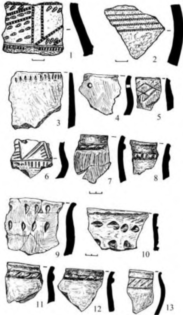
Рис. 1. Кераміка зрубної культурно-історичної спільності