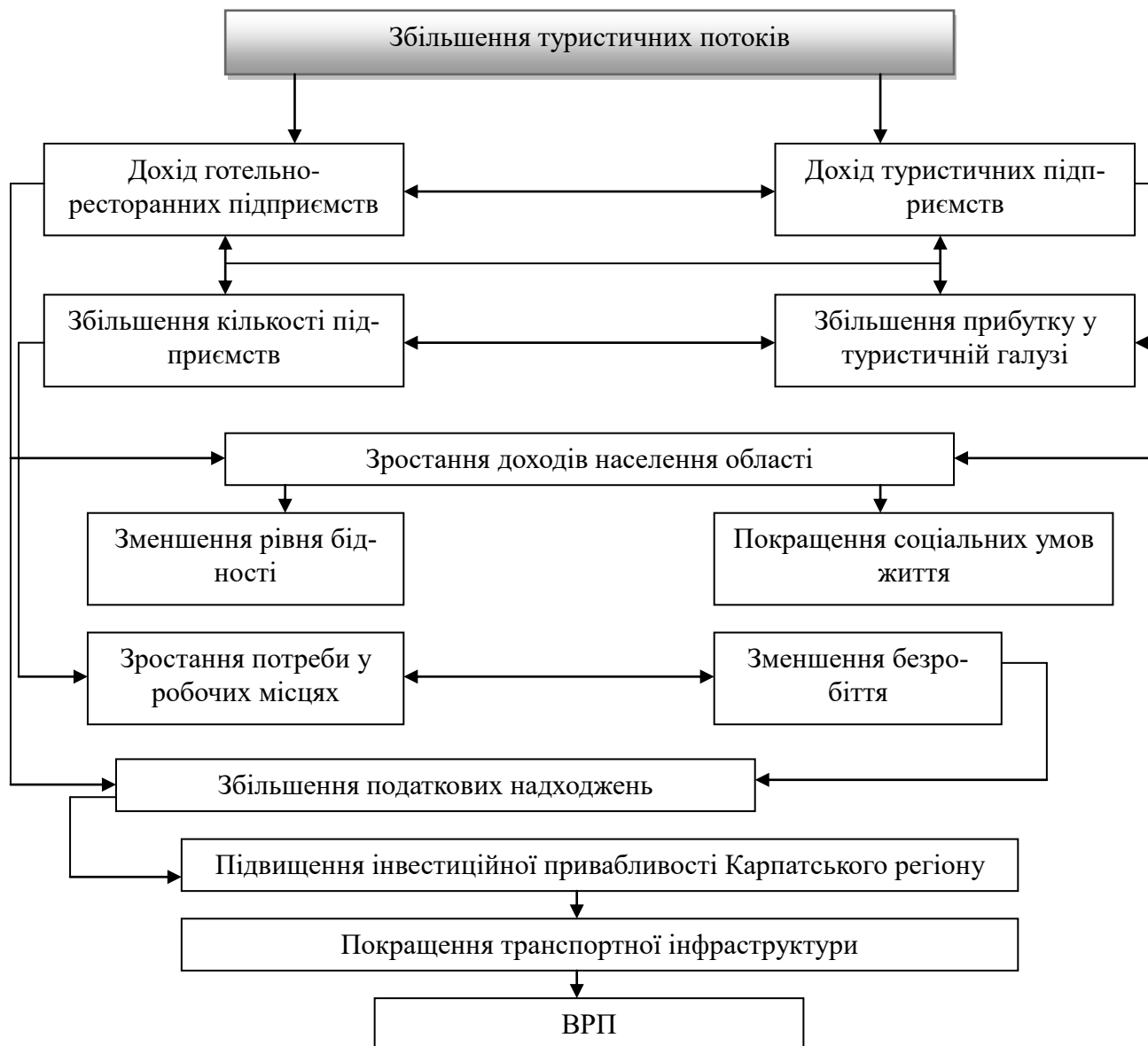
Рис. 2. Модель впливу туризму на соціально-економічний розвиток Карпатського регіону (власна розробка автора)

рмується на основі таких елементів, як збільшення туристичних потоків, збільшення доходів готельно-ресторанних підприємств та туристичних підприємств, зростання доходів населення, зменшення рівня бідності та покращення соціальних умов життя, зростання потреби у робочій силі та зменшення безробіття, що у свою чергу призведе до збільшення податкових надходжень, підвищення інвестиційної привабливості області, покращення транспортної інфраструктури та зростання ВРП (див рис. 2).