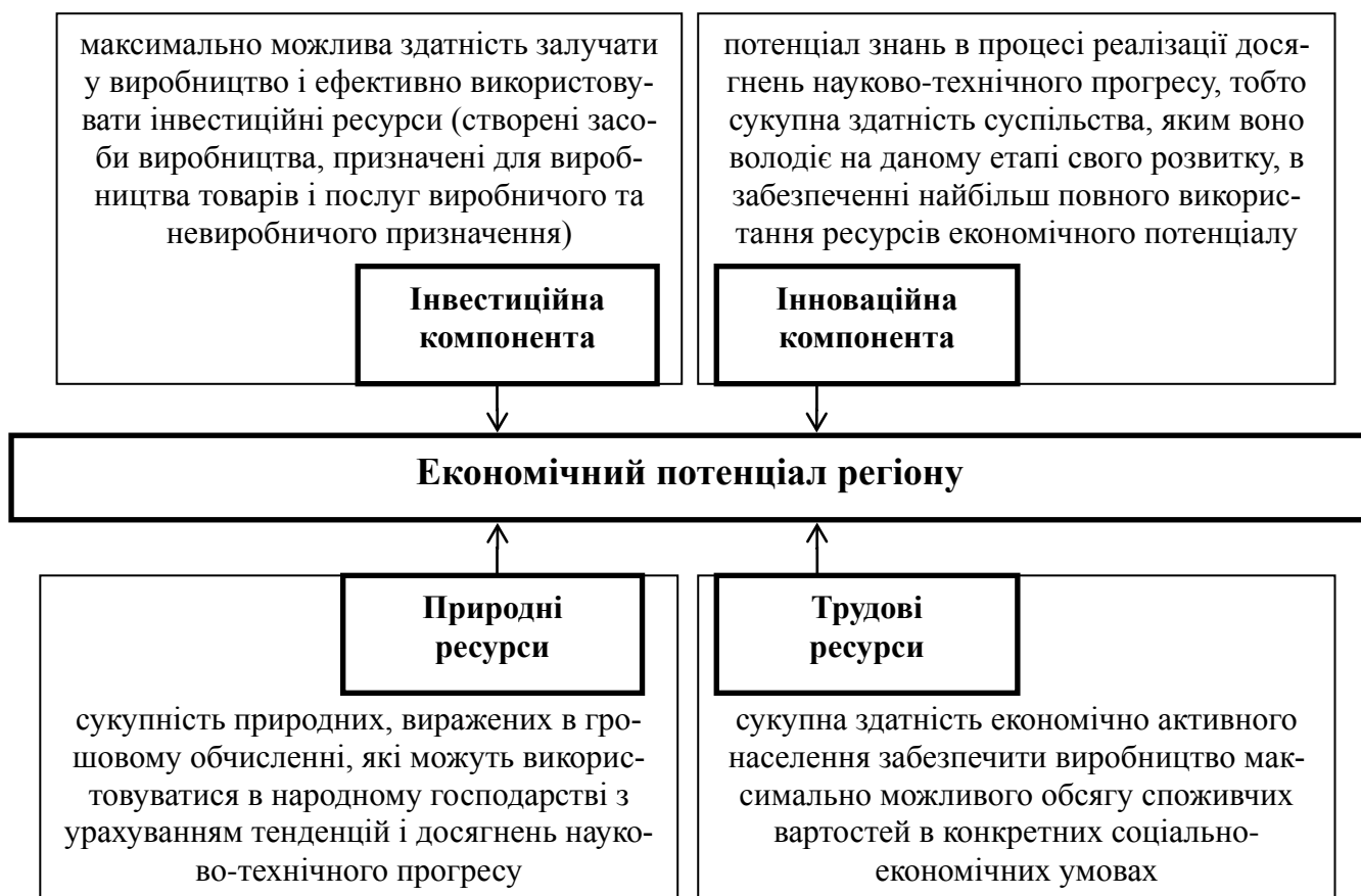
Рис. 1. Складові компоненти економічного потенціалу (складено автором за даними [2]).

Традиційно, економічний потенціал розуміють як «здатність наявних у межах регіону економічних ресурсів забезпечити виробництво максимально можливого обсягу матеріальних послуг, відповідних потребам суспільства на даному етапі його розвитку» [6]. Економічний потенціал регіону включає чотири головні компоненти (інвестиційний, інноваційний, природний, трудовий), які в свою чергу є складовими сукупного економічного потенціалу (рис. 1). У сумарному обчисленні економічний потенціал Харківської області можна оцінити в 24444 млн.грн (станом на 2011 рік). Найбільш вагома компонента в економічному потенціалі регіону – інвестиційний потенціал. В економічному потенціалі Харківської області на інвестиційну складову доводиться 42,8%, трудовий потенціал – 36,1%, природно-ресурсний потенціал – 21,1% [2,7,9].