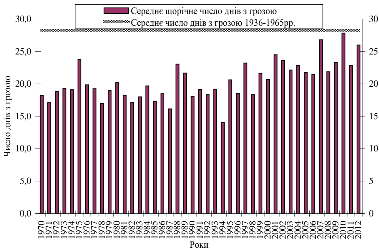
Рис. 2 Щорічне сумарне число днів з грозою на території України за період 1970 – 2012 рр.

Для розвитку таких хмарних утворень необхідні: підвищена температура повітря, збільшений вологовміст повітря, а для розвитку потужних конвективних хмар основним є наявність висотної баричної улоговини, де термічна конвекція посилюється динамічним фактором.