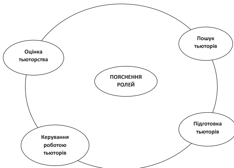
Рис. 1. Коло якості тьюторства

Якість тьюторства в опануванні германськими мовами залежить від успіху різних робочих процесів, які можна відобразити у кругообігу підвищення якості роботи тьюторів (рис. 1).