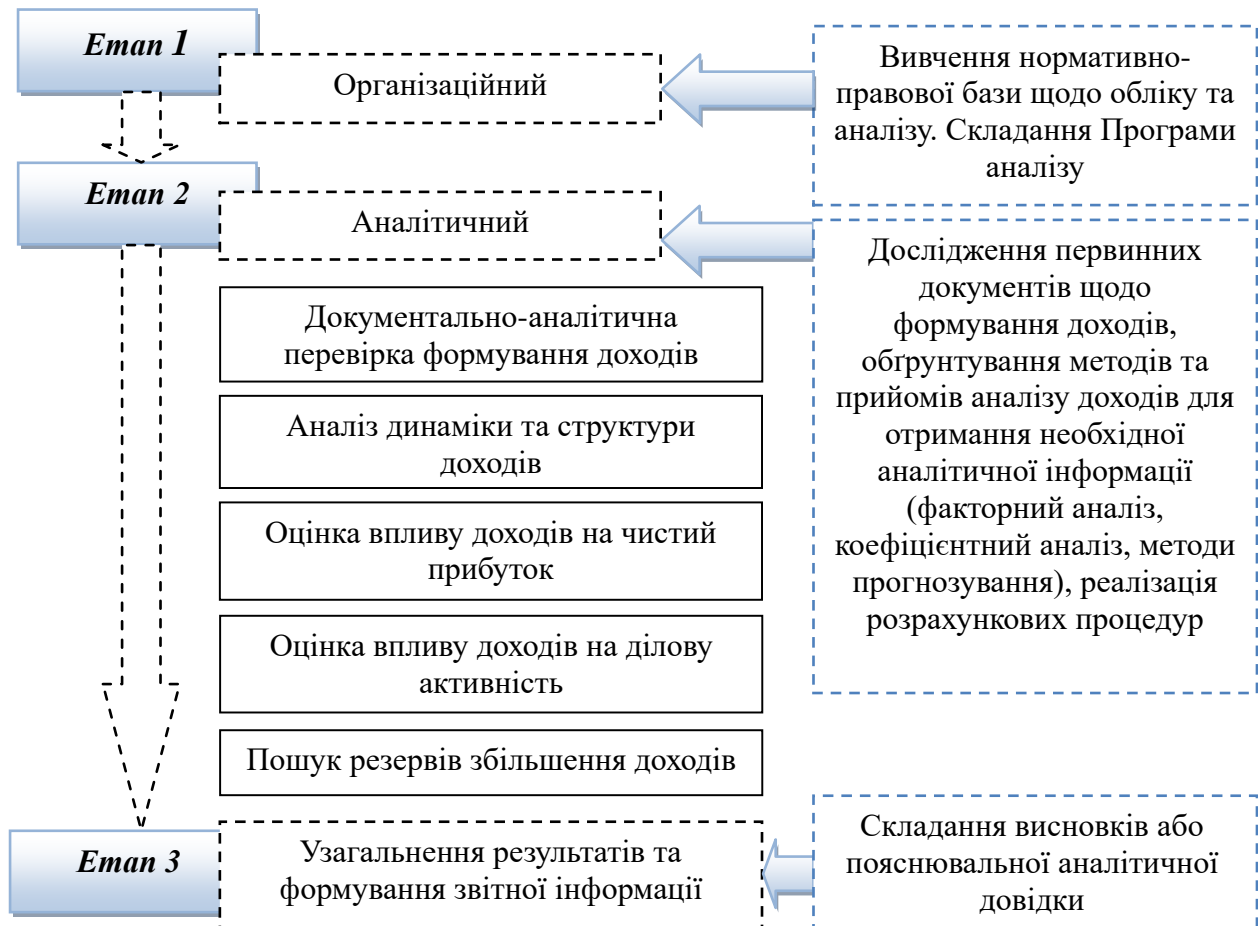
Рисунок 3. Програма аналізу доходів для формування аналітичної інформації Figure 3. Income analysis program for generating analytical information

контрагента (клієнта), вартість залучення контрагентів (клієнтів). Якщо бухгалтер-аналітик відповідає за фінансову управлінську звітність, то варто створити згуртовану робочу групу з відповідних фахівців усередині вашої організації, щоб регулярно збиратися та оцінювати актуальність ваших КРІ чи показників [13, 15].