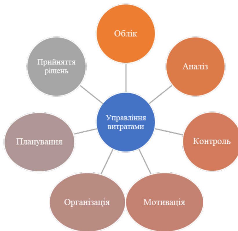
Рис.2. Елементи процесу управління витратами

Аналізуючи витрати підприємства, є можливість дослідити доцільність і раціональність їх здійснення та визначити фактори, які на них впливають, резерви зниження витрат та їх напрями оптимізації; забезпечити інформаційну базу для планування та прийняття рішень. Елементи процесу управління витратами (рис.2). Управління витратами тісно пов'язане з менеджментом та економікою, поєднує в собі риси операційного та фінансового менеджменту з метою оптимізації витрат та максимізації успішної діяльності українських бізнесменів [5]. В умовах економічної кризи досягнення бажаного ефекту при найменшому задіянні ресурсів підприємства залежить від обраних методів управління витратами, що являє їх зниження.