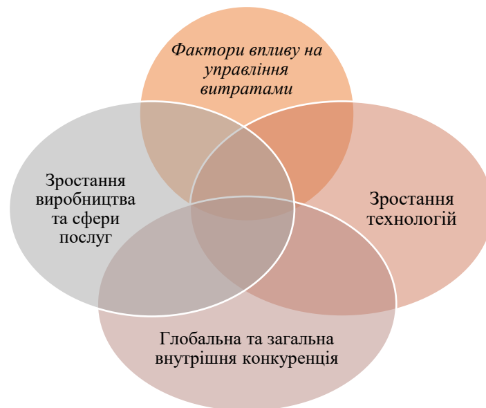
Рис.5. Фактори, які впливають на управління витратами