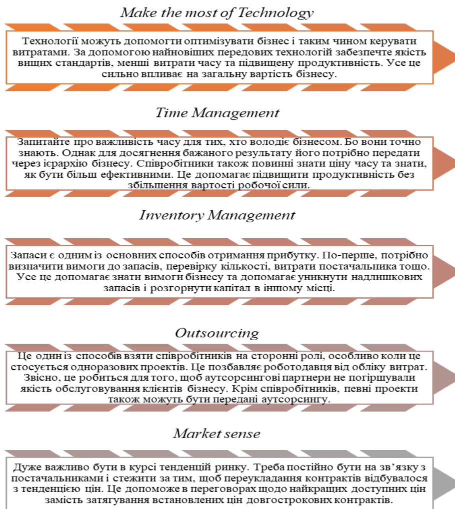
Рис.5. Допоміжні методи в управлінні витратами зарубіжних країн

Зарубіжні методи управління витратами для бізнесу, які можна використати для допомоги контролю та підтримки витрат в необхідних межах (рис.5).