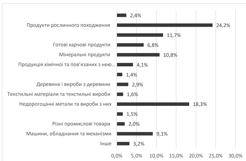
Рис. 1. Групи товарів за часткою з загального обсягу експортованих товарів

Згідно з даними Державної служби статистика України у 2020 році на експорт товару припадає 83,4% від всієї кількості експорту України. В 2019 році цей показник становив 83,7%. Розподіл груп товарів, які експортуються з України, за їх часткою з загального обсягу експортованих товарів наведено на рис. 1.