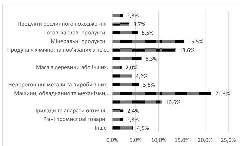
Рис. 1. Групи товарів за часткою з загального обсягу імпортованих товарів

Розподіл груп товарів, які імпортуються в Україну, за їх часткою з загального обсягу експортованих товарів наведено на рис. 1.