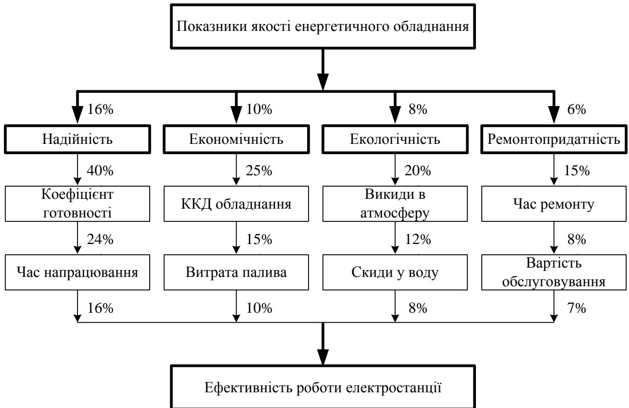
Рис. 2 – Структура показників якості енергетичного обладнання та їх вплив на ефективність роботи електростанції