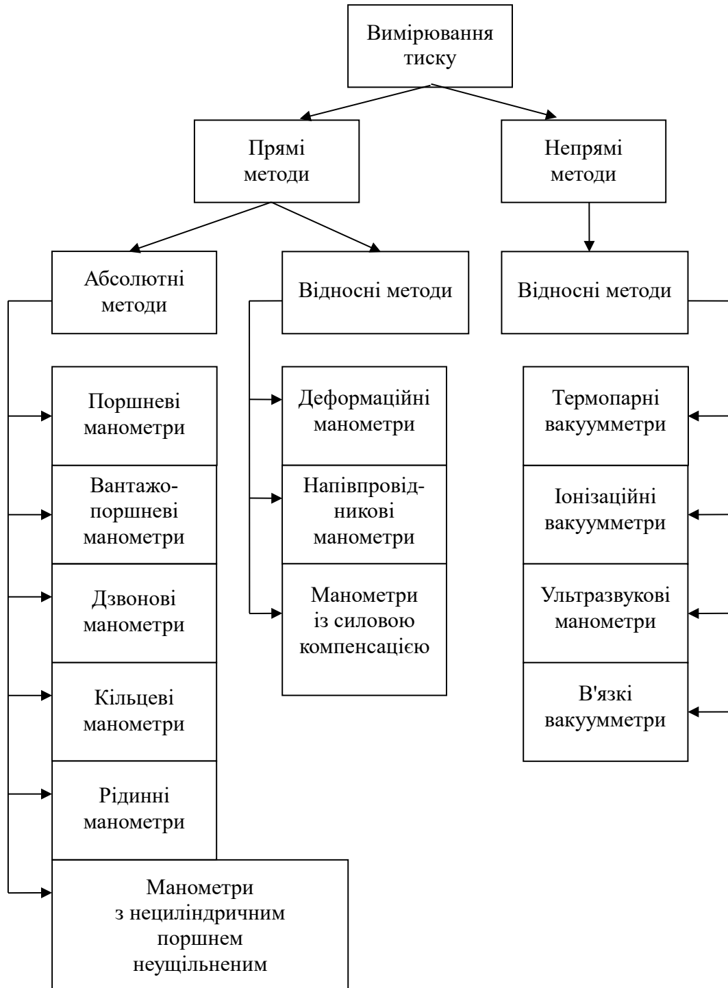
Рис. 2 – Методи вимірювання тиску (напору)

До основних факторів, що впливають на точність ультразвукових витратомірів можна віднести мінливість або неточність визначення товщини стінок трубопроводу, швидкості звуку в призмах, стінках трубопроводу і воді, епюри швидкостей води [17].