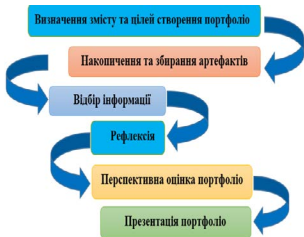
Рис. 3. Етапи створення портфоліо

Порядок етапів, які необхідні при формуванні портфоліо (представлені на рис. 3), а опис цих етапів розглянемо більш детально: