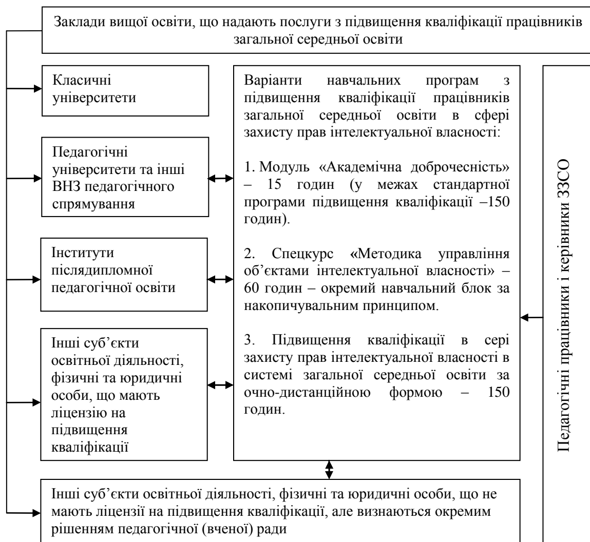
Рис. 1. Концептуальна модель підвищення кваліфікації працівників загальної середньої освіти у сфері захисту прав інтелектуальної власності

Стаття Закону [7] передбачає: дотримання академічної доброчесності педагогічними працівниками (вчителями, керівниками) та здобувачами освіти (учнями), а також відповідальність за порушення академічної доброчесності. Тому модуль «Академічна доброчесність» програми курсів підвищення кваліфікації педагогічних працівників ЗЗСО повинен містити саме ці теми.