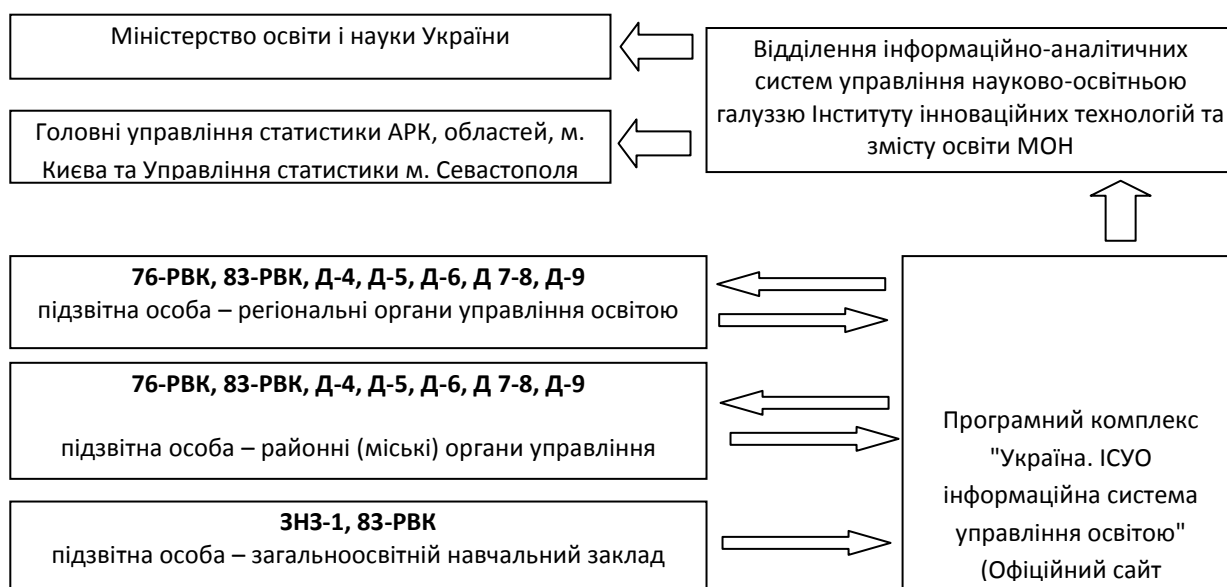
Рис. 1. Етапність формування звітності відповідно до програмного комплексу "Україна. ІСУО інформаційна система управління освітою"

Відповідно до встановленого порядку етапність формування електронної звітності представлена на рис. 1.