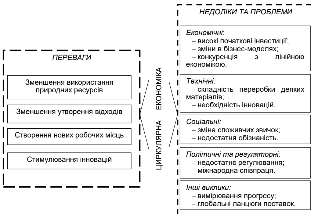
Рис. 2. Переваги та недоліки циркулярної економіки Fig. 2. Advantages and disadvantages of the circular economy