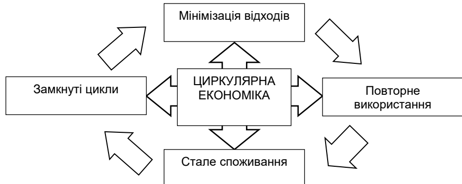
Рис 1. Основні принципи циркулярної економіки Fig. 1. Basic principles of the circular economy

За даними звіту Європейської Комісії (Circular economy: definition, importance and benefits, 2023), впровадження циркулярної економіки може сприяти зростанню ВВП на 0.5% та створенню понад 700 тисяч нових робочих місць до 2030 року. Дослідження (Приклади впровадження циркулярної економіки в Україні, 2024; Про схвалення Стратегії відновлення, 2024; ЮНІДО, 2024) показують, що більш ефективне використання ресурсів та енергії може значно знизити виробничі витрати і підвищити конкурентоспроможність підприємств.