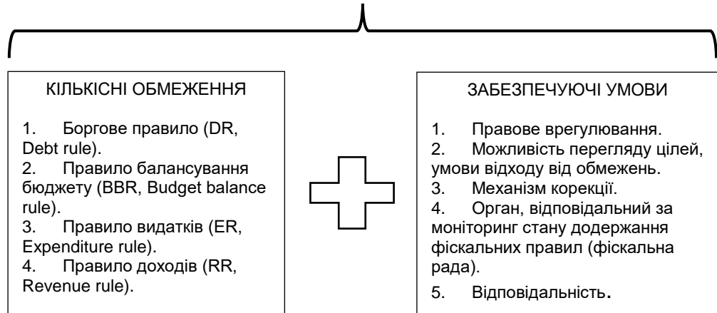
Рис. 2. Складові фіскальних правил