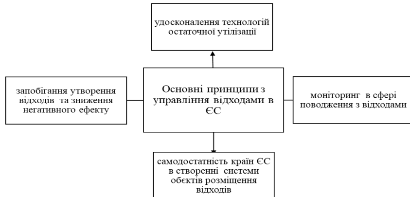
Рис.1. Основні принципи з управління відходами в ЄС Fig.1. Basic principles of waste management in the EU

У європейському законодавстві визначено необхідність здійснення заходів для «забезпечення високої якості переробки», для цього передбачено впровадження роздільного збору відходів. В свою чергу, впровадження цього заходу передбачає наявність технічних, екологічних, економічних (фінансових) можливостей. У європейських країнах впроваджено роздільний збір, паперу, металів, пластику та скла з 2015 р. Нормативно-правові документи ЄС встановлюють основні принципи з управління відходами в ЄС (рис. 1).